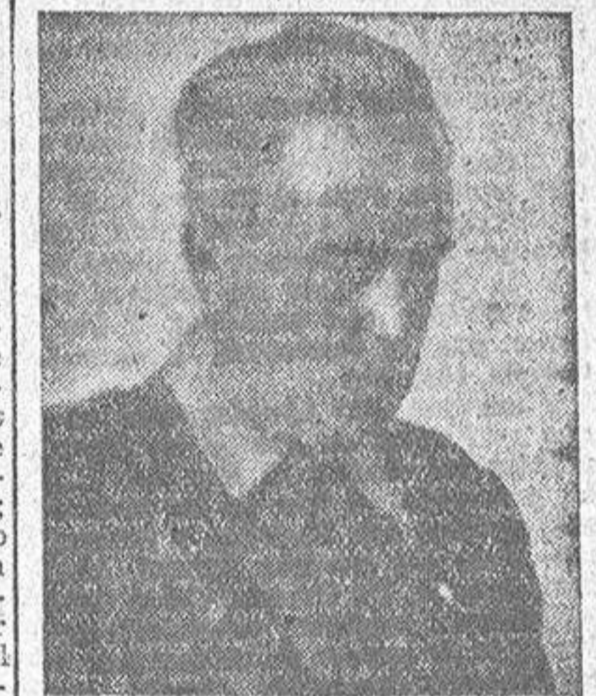
Teniente general don Camilo Alonso Vega

Fue recibido en el Pentágono donde el teniente general Alonso Vega manifiesta haber sido acogido con honores extraordinarios y con toda clase de atenciones. Manifestó que en Santo Domingo y en Puerto Rico había recibido entusiastas y emotivas manifestaciones de afecto hacia la Ma-