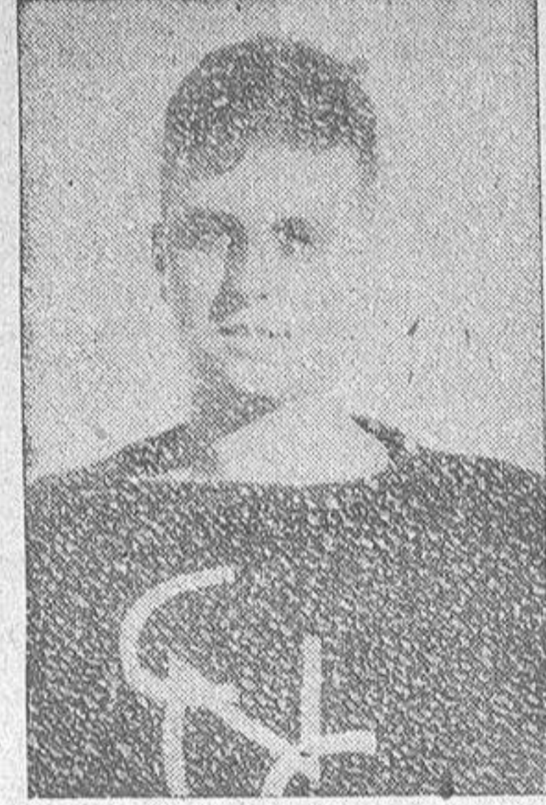
Sobre el clásico recorrido de 3.800 metros que media entre la playa de Santa Cristina y la escalera del Real Club Náutico, fué disputada ayer la prueba que suele cerrar la temporada coruñesa de natación.