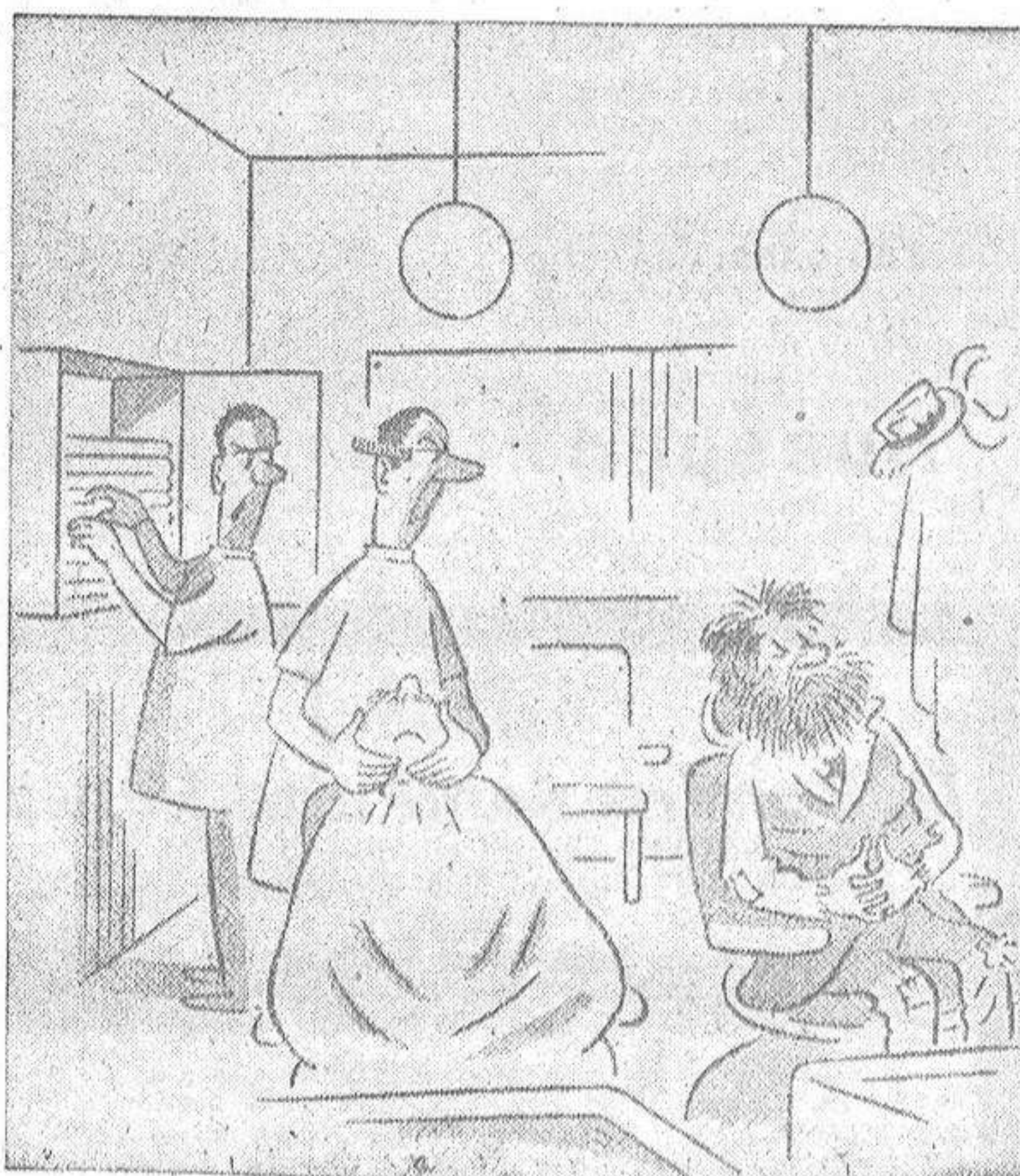
—Viene cada seis meses, se sienta, y dice: "lo de siempre".