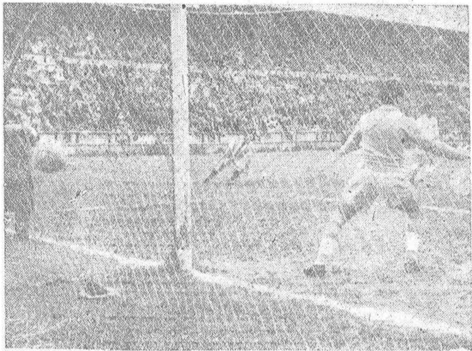
Poco antes de terminar la primera parte, Moll sorprendió con su tiro a la media vuelta, al meta zaragozano Higinio, que todavía no se ha dado cuenta de que tiene el balón dentro de casa