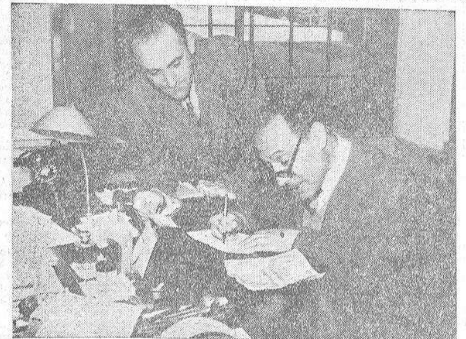
La suerte hay que repartirla bien. En la oficina ha llegado el momento de los intercambios, de las participaciones, de los cálculos. Hay que entender recibos y hacer "décimos" de los "décimos", ¡si hubiera suerte!