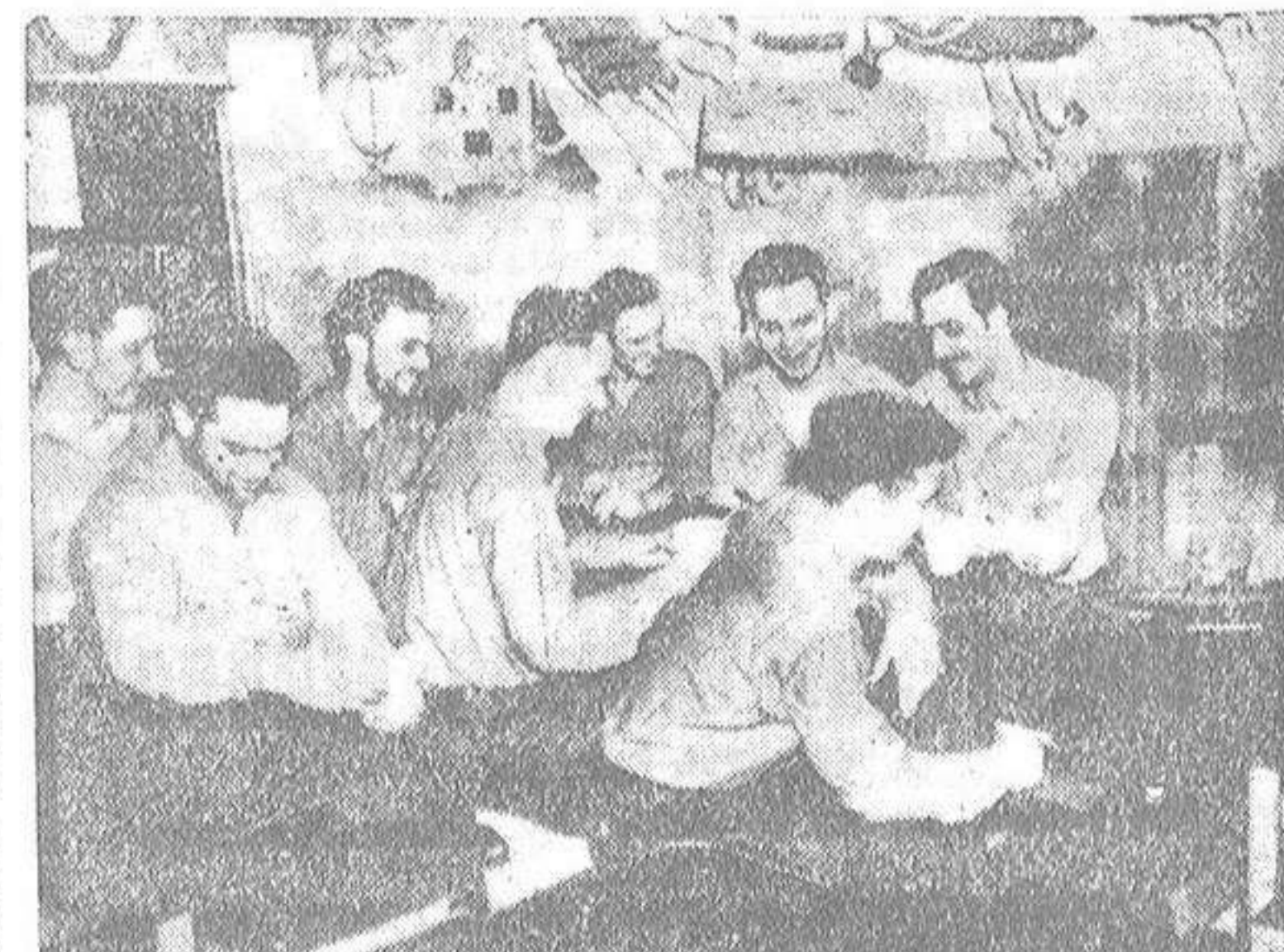
Aquí tienen ustedes una parte de los veintitrés hombres que se han prestado a servir de conejos de indias humanos en la experiencia del tiempo que el organismo humano puede soportar viviendo en un submarino sin contacto alguno con la atmósfera exterior, respirando aire vitado y sin recibir más que luz artificial. Se trata de marineros norteamericanos que llevan ya en esa forma cerca de sesenta días y que se preparan para la futura navegación submarina atómica.

Todos los días una comisión de cinco científicos abre solemnemente la compuerta del submarino y penetra cargado de nuevo desde dentro. Es (CONTINUA EN SEPTIMA PLANA)