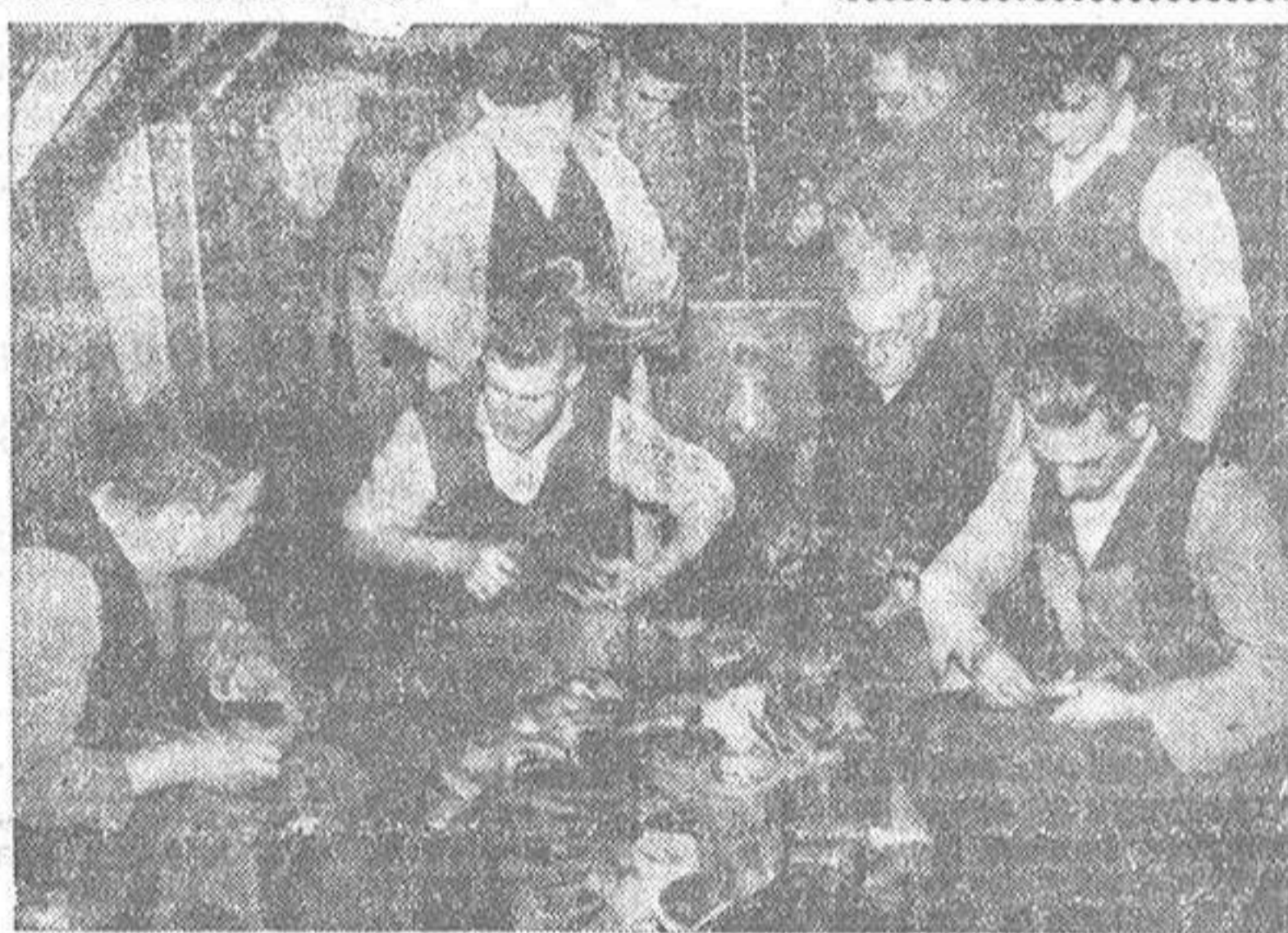
El taller, en plena tarea. Los zapatos más inverosímilmente maltrechos son restaurados aquí, uno de los talleres coruñeses, por este grupo de especialistas que va desde el maestro hasta el aprendiz, pasando por "ases" del oficio.

(Reportaje de Orestes Vara Calzada en 8.ª página)