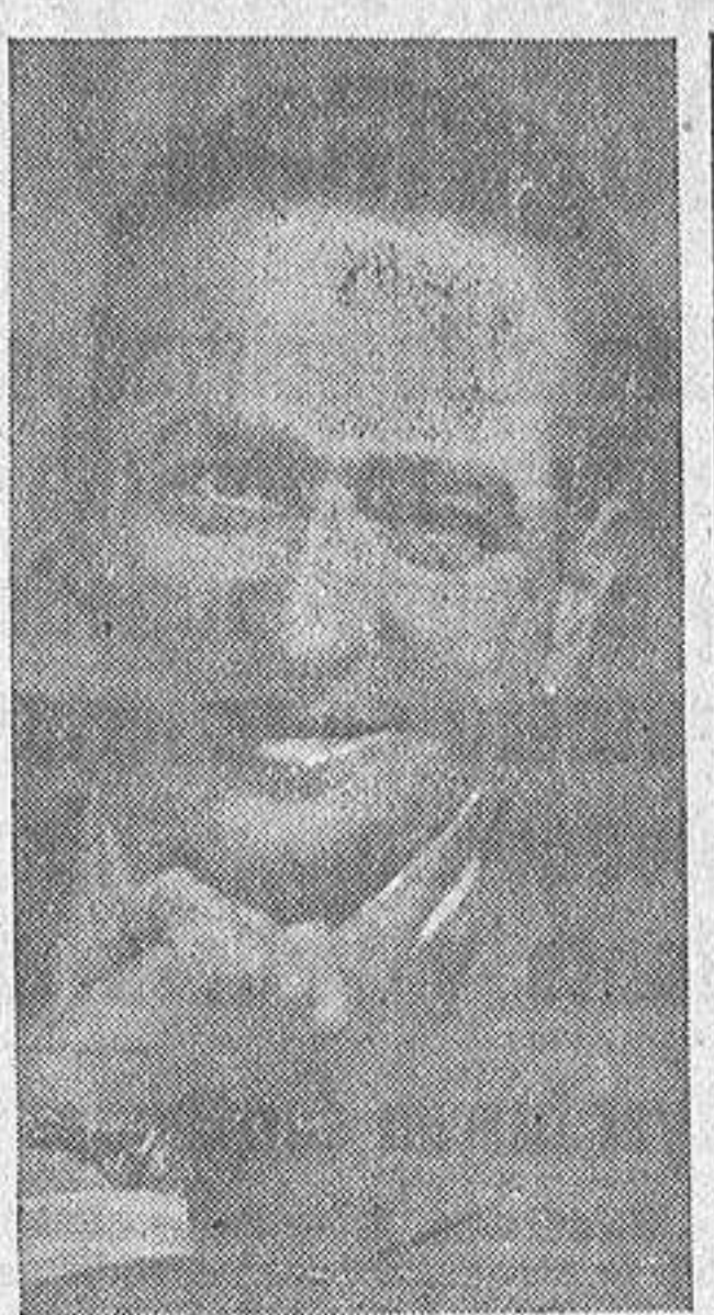
Ilustre ya desaparecido desgraciadamente del mundo, dijo un día el autor de mis días: —Tu hijo está loco. Hazlo militar y que abandone esa quimera de escribir. Los bustidos proporcionan más disgustos que satisfacciones.

Mi obsesión por el teatro no sólo no se entibaba sino que crecía por momentos y a tal punto llegó, que un muy amigo de mi padre, comediógrafo