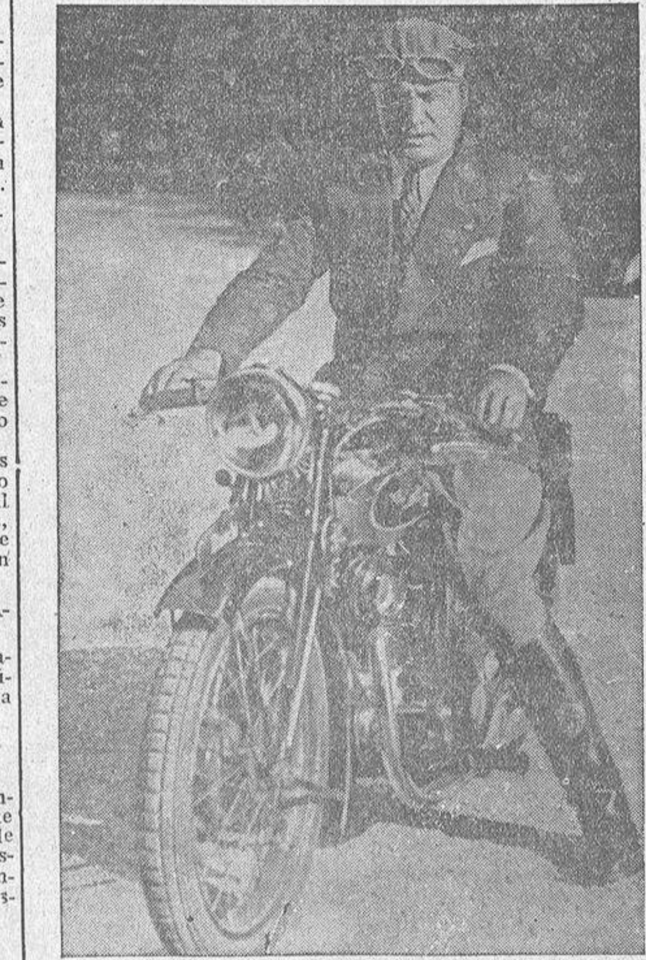
Mussolini, que cultiva varios deportes, es un experto motorista

Con este motivo han sido detenidas numerosas personas, acusadas de preparar una sublevación contra el "gobierno" rojo.