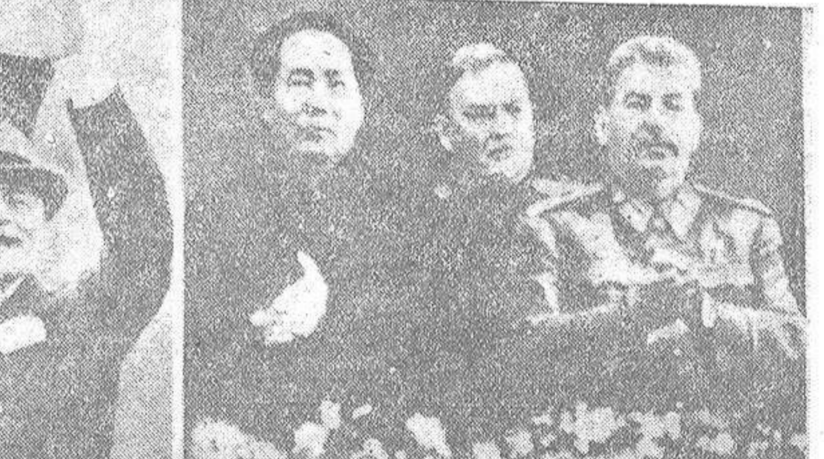
El jefe de la China Roja aparece en la foto de la izquierda al lado del representante norteamericano, Mr. Hurley, al terminar la guerra. A la derecha, se le ve devotamente al lado de Stalin, cinco años después de aquella fecha.