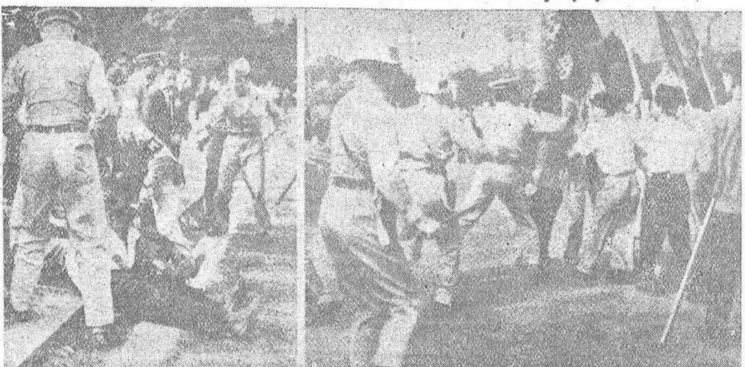
La policía militar norteamericana de Tokio tiene que actuar, por vez primera, contra grupos de manifestantes comunistas japoneses, que hicieron objeto de sus ataques a aquélla.