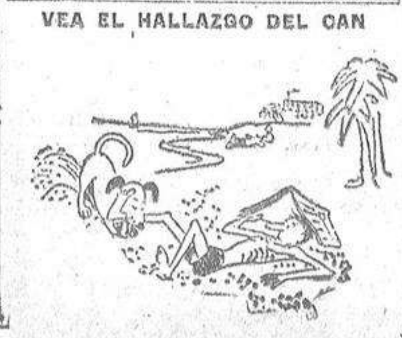
VEA EL HALLAZGO DEL CAN

LONDRES, 18.—Los amigos de la princesa Margarita han declarado que suponen que el Rey Jorge probablemente anunciará antes del otoño el compromiso matrimonial de la princesa.—(EFE).