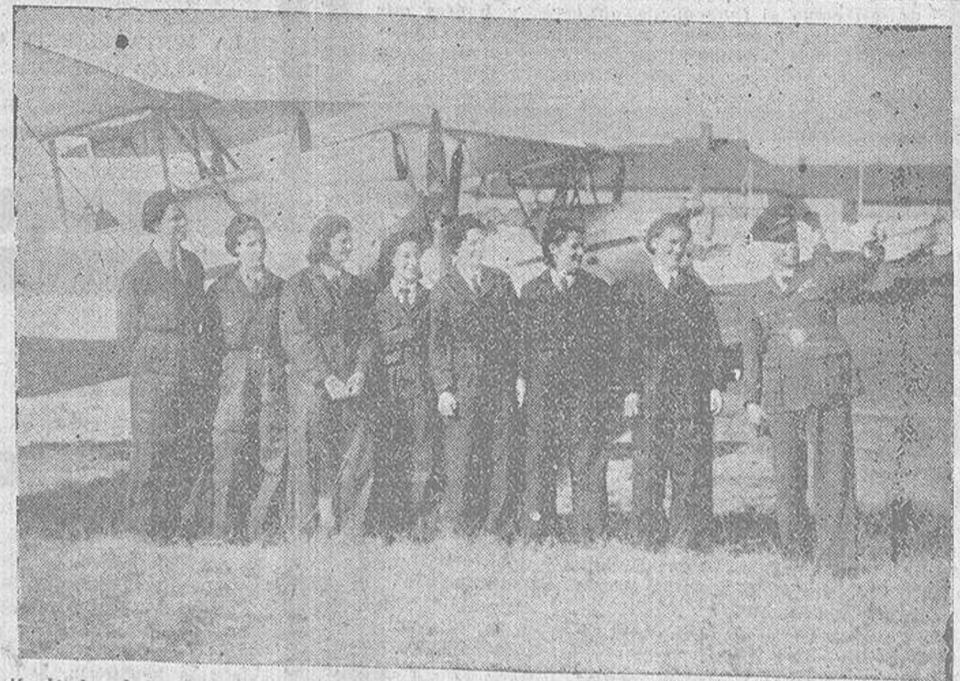
Muchachas de la Asociación Femáeroica cerca de la ciudad del Sur, haciendo instrucción en un aeródromo de Aviación, de Africa del Cabo

Lea usted todos los lunes la «Hoja Oficial» de La Coruña