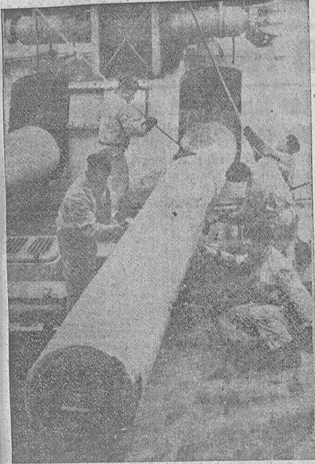
Limpieza y cuidado de la artillería a bordo de un acorazado alemán

Afortunadamente no hubo que lamentar desgracias personales. La policía realiza activas pesquisas para encontrar a los autores del atentado, cuyas causas se desconocen. — Stefani.