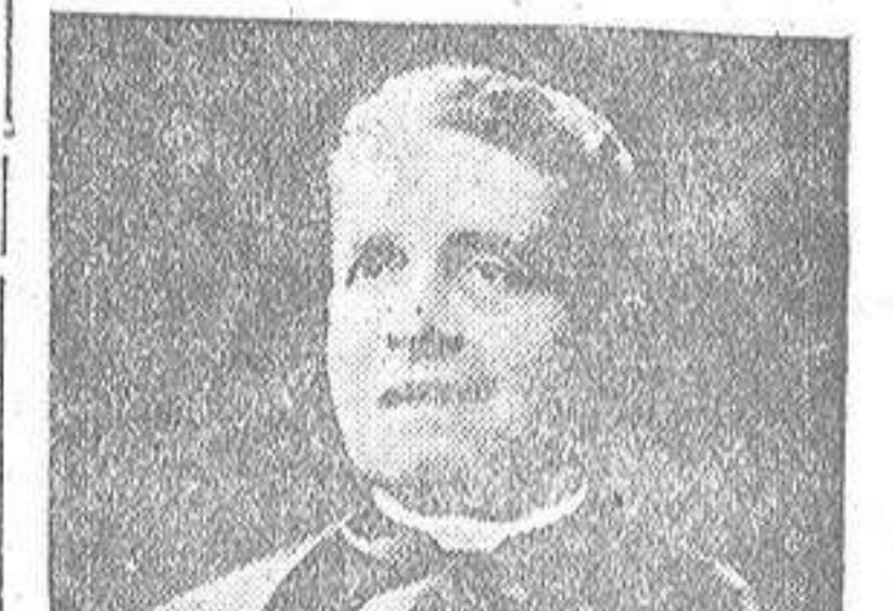
Monsieur DOMENICO TARDINI (4)

Yuri Gagarin, el primer cosmonauta soviético se ha convertido en instrumento de propaganda política. Londres y Polonia han sido los primeros escenarios elegidos por el Kremlin para enviar al "hombre del espacio", que en la actualidad se encuentra en Cuba como huésped de honor del Gobierno fidelista. Aquí lo vemos, condecorado de condecoraciones soviéticas y de pie sobre un "Rolls" descapotable correspondiendo a la curiosidad de un grupo de londinenses. Durante su estancia en Inglaterra, el piloto soviético recibió la medalla de oro de la Sociedad Interplanetaria.