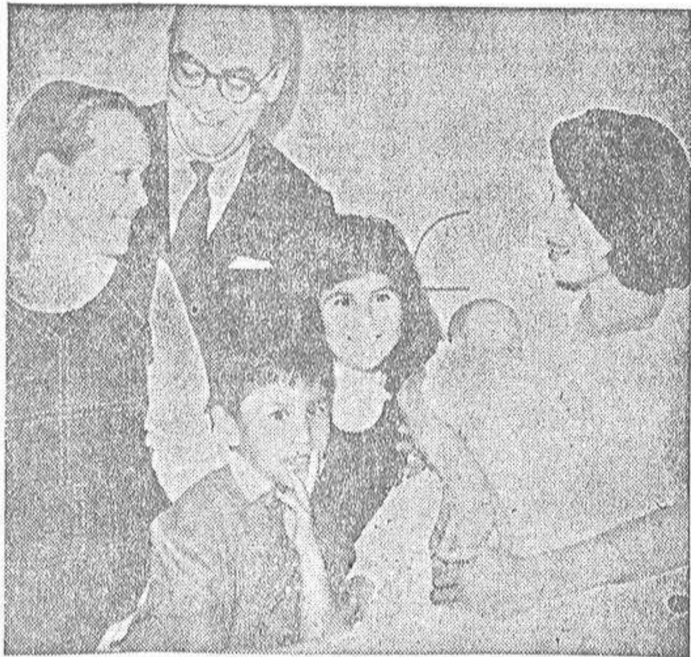
Silvana Mangano, la conocida estrella italiana, esposa del productor Dino de Laurentis, ha tenido su cuarto hijo, una niña que viene a completar las dos parejas de ambos sexos que alegran el hogar de la famosa intérprete de «Arroz amargo». En la clínica donde arribó la cigüeña aparece la familia Laurentis en pleno, todos con gestos auténticamente felices, excepto la recién nacida, que aún no tuvo tiempo de aprender a sonreír