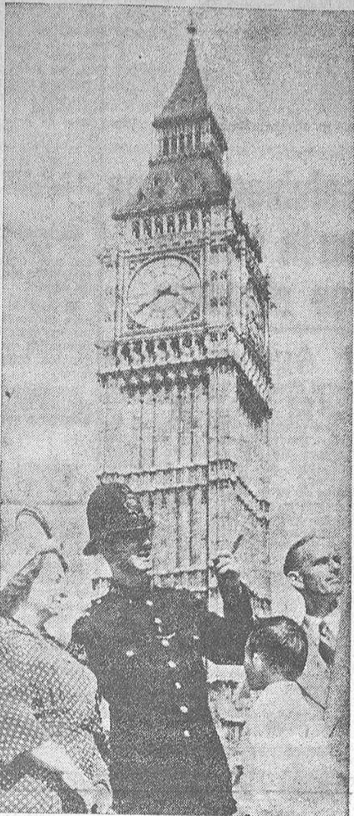
Turistas norteamericanos piden información a un policía londinense

En general, la impresión de estos turistas es de que los precios en Inglaterra son bastante más altos que en los Estados Unidos, y confiesan que comen peor. Esto lo dulcifican mucho los periódicos británicos, que, en cambio, resaltan la grata sorpresa de sus visitantes del otro lado del Atlántico, al encontrar con que un corte de pelo es más económico en Londres que en California. Este ya es un consuelo, y si lo saben explotar, no será extraño que se organicen excursiones colectivas de melendados norteamericanos a raparse en las "Barber shops" londinenses.