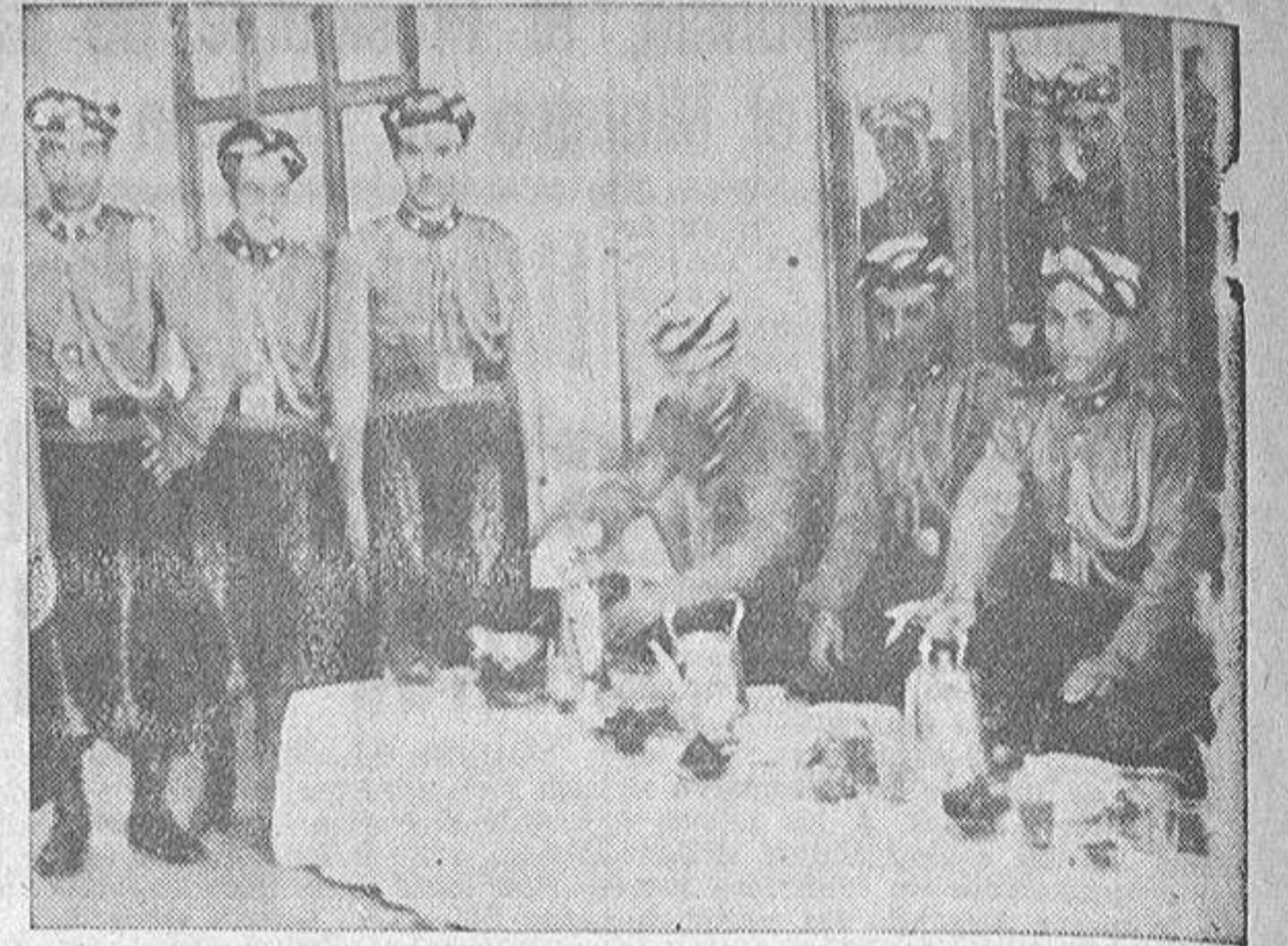
Los músicos de la Banda Jalliana preparando el tè moruno con que fué obsequiada la esposa de S. E. el Jefe del Estado

Lunes 12 Septiembre de 1949.—Avenida de Rubine, 10. — Tfnos. 1542-1177