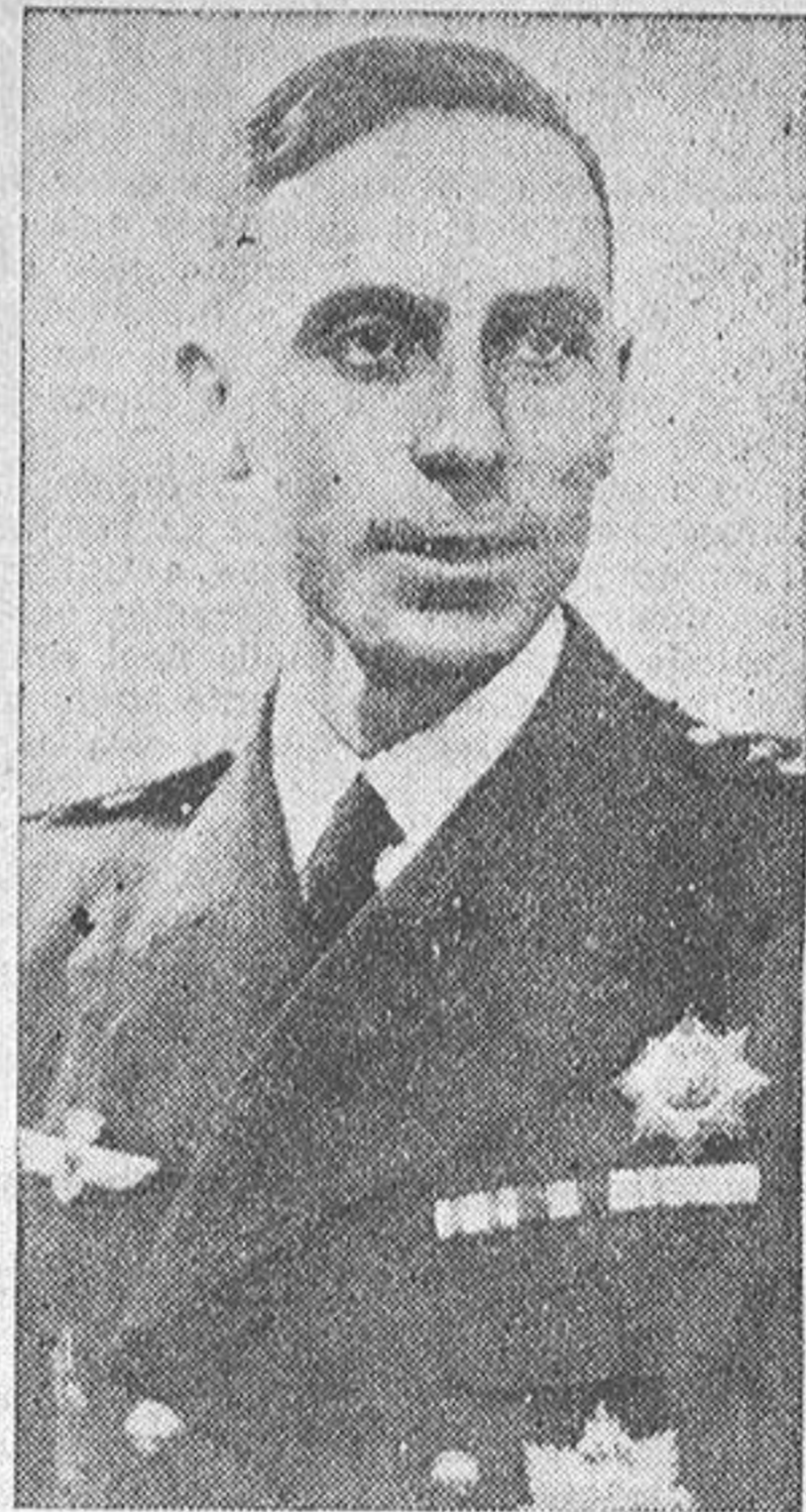
Un relevante coruñés, cuya personalidad no es en su ciudad natal todo lo conocida y admirada que debiera serlo, ha regresado a Madrid después de su acostumbrada permanencia anual entre nosotros.