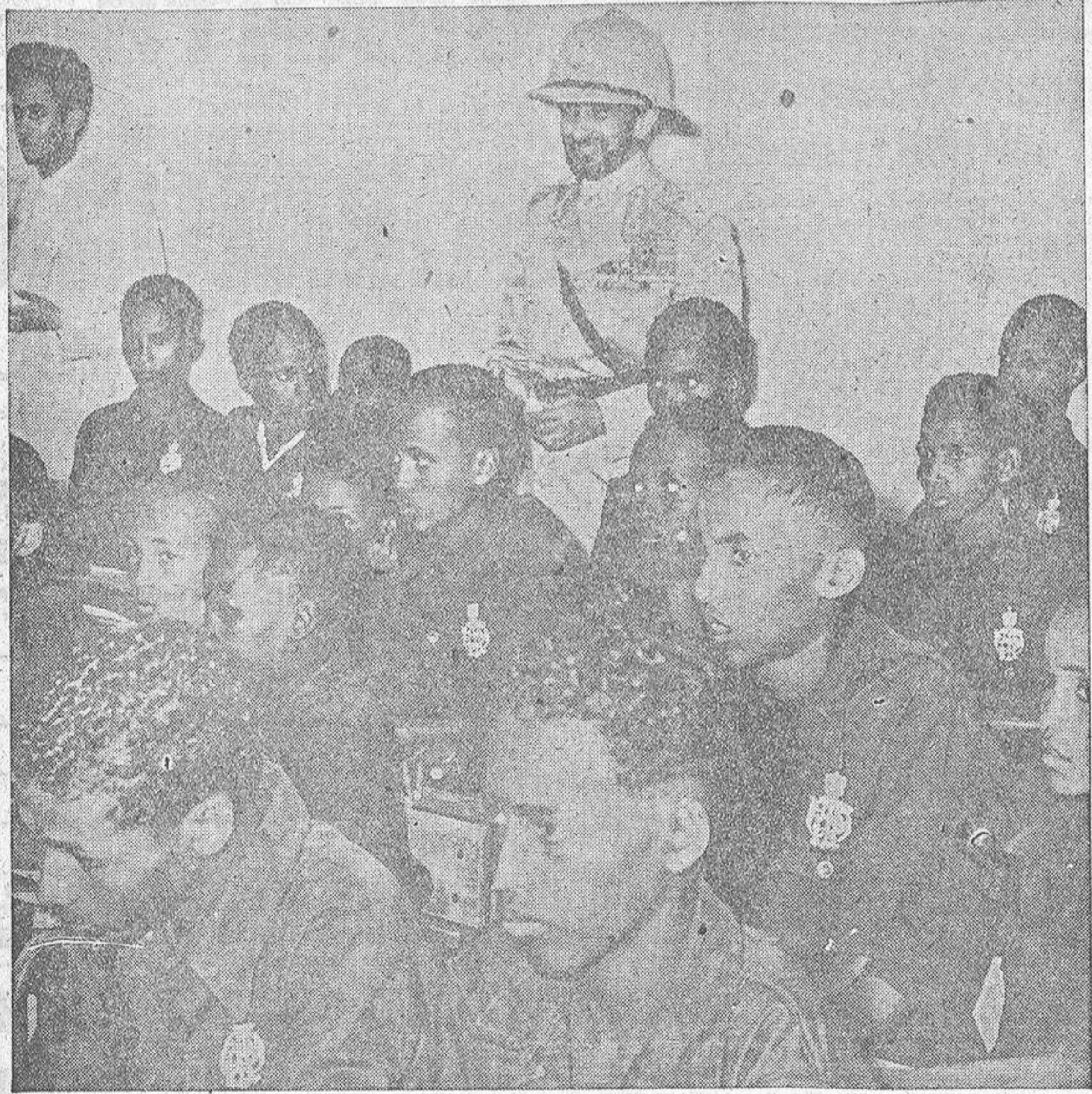
El Emperador de Abisinia, en traje de gala y con el pecho cubierto de condecoraciones, visita una escuela que ha fundado hace algún tiempo en la provincia de Harar. El Negus es particularmente aficionado a esta región de su imperio. De muchacho fue educado en una misión católica de Harar, y antes de ascender

al trono--que hace tres mil años fue el del Rey Salomón--había sido gobernador de esta provincia. Haile Selassie hace ahora una visita al colegio que lleva su nombre y que tanto trae a su memoria diversas incidencias de su infancia.