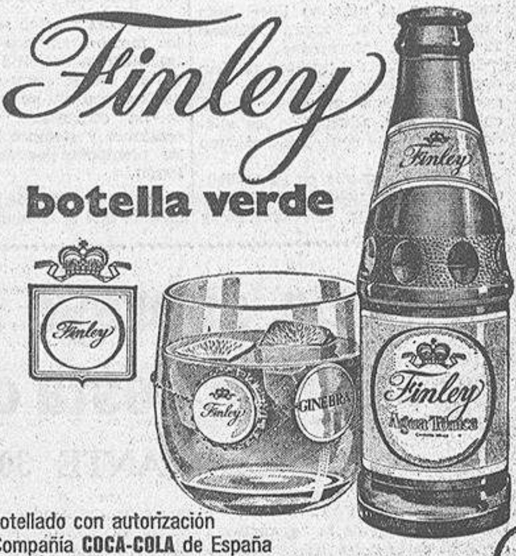
Embotellado con autorización de Compañía COCA-COLA de España

Desde luego las distracciones y entretenimientos, como antes hemos indicado, son una auténtica necesidad, pero no creemos puedan condicionarse de manera caprichosa, estableciendo una norma determinada, ya que ello iría en contra de la libre determinación del individuo.