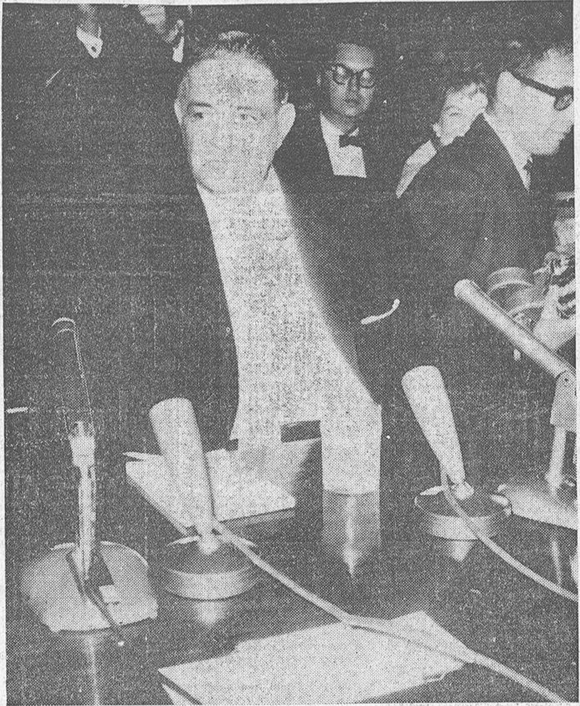
Joe Valachi, en 1963, ante la Comisión del Senado de los Estados Unidos.

DURANTE cuatro días en el depósito de cadáveres de la prisión federal de Tuna al sur de Texas el cuerpo de un hombre ha esperado que alguien viniera a reclamarlo. Pero al parecer a nadie interesaba el cadáver de Joe Valachi que fue a parar finalmente a la fosa común. Ni a su familia de la que no se sabe nada con certeza, ni de esa otra "familia", a la que sirvió durante 30 años la "Cosa Nostra". Nadie ha rezado por Joe Valachi, el asesino a sueldo muerto de un vulgar infarto de micardio, a los 67 años. A los 19 años, recién salido de un reformatorio, era miembro de una banda de pequeña importancia que desvalijaba comercios. En un tiroteo con la policía, Joe recibió un balazo en la cabeza. Sus compañeros consiguieron meterlo en un automóvil y llevarlo a casa de un cirujano al servicio del hampa. Este, como anestesia, le hizo beber un litro de mal whisky de contrabando y le extrajo la bala. La muerte esperaba 47 años más a Joe Valachi.