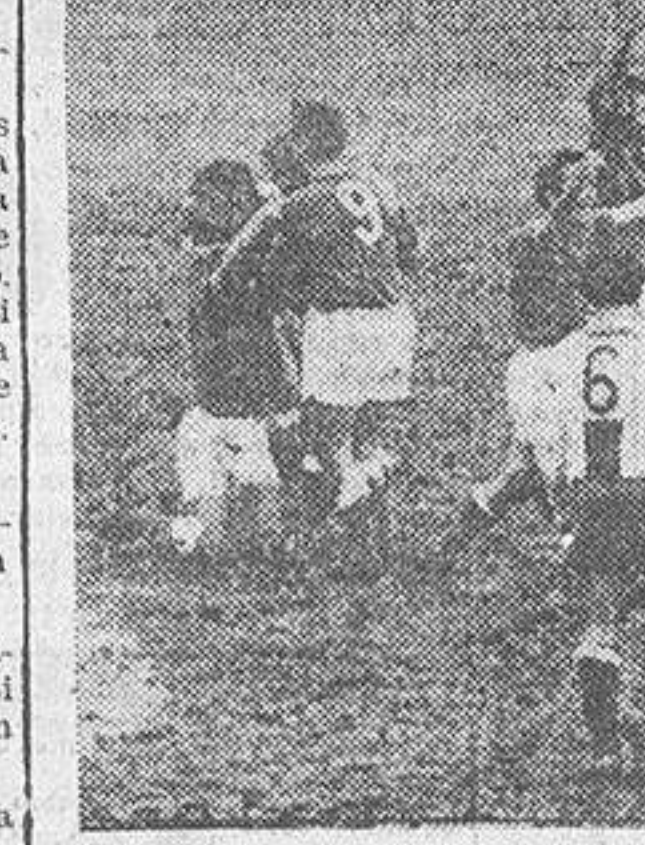
La escena que reproduce el grabado, es bi en elocuente: alegría incontenible en los jugadores del Ferrol y desolación entre los deportivistas. El primer gol del partido, que sería el único, acaba de subir al marcador, favorable al club verde, en premio a su mejor juego y mayor cordicia