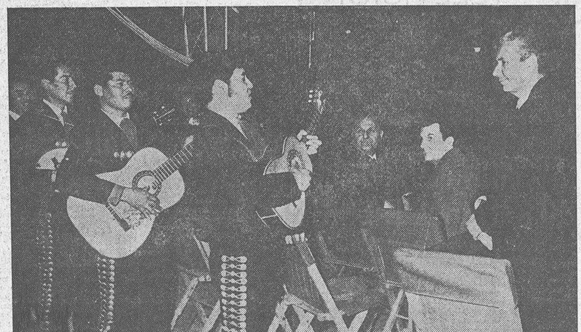
Aldo Moro, ministro italiano de Asuntos Exteriores, es un gran aficionado al circo. Lamenta que sus ocupaciones políticas no le permitan acudir a su espectáculo favorito tantas veces como lo desea. Hace días, sin embargo, pudo ver cumplido este anhelo. Con motivo de la actuación en Roma del "Circo Mejicano", Moro decidió presenciar por unas horas de toda clase de obligaciones para sentarse en una silla de paja. Los artistas, percatados de su presencia, le dedicaron varios números. Aquí lo vemos en el momento de escuchar la canción que le ofrece un conjunto folclórico.