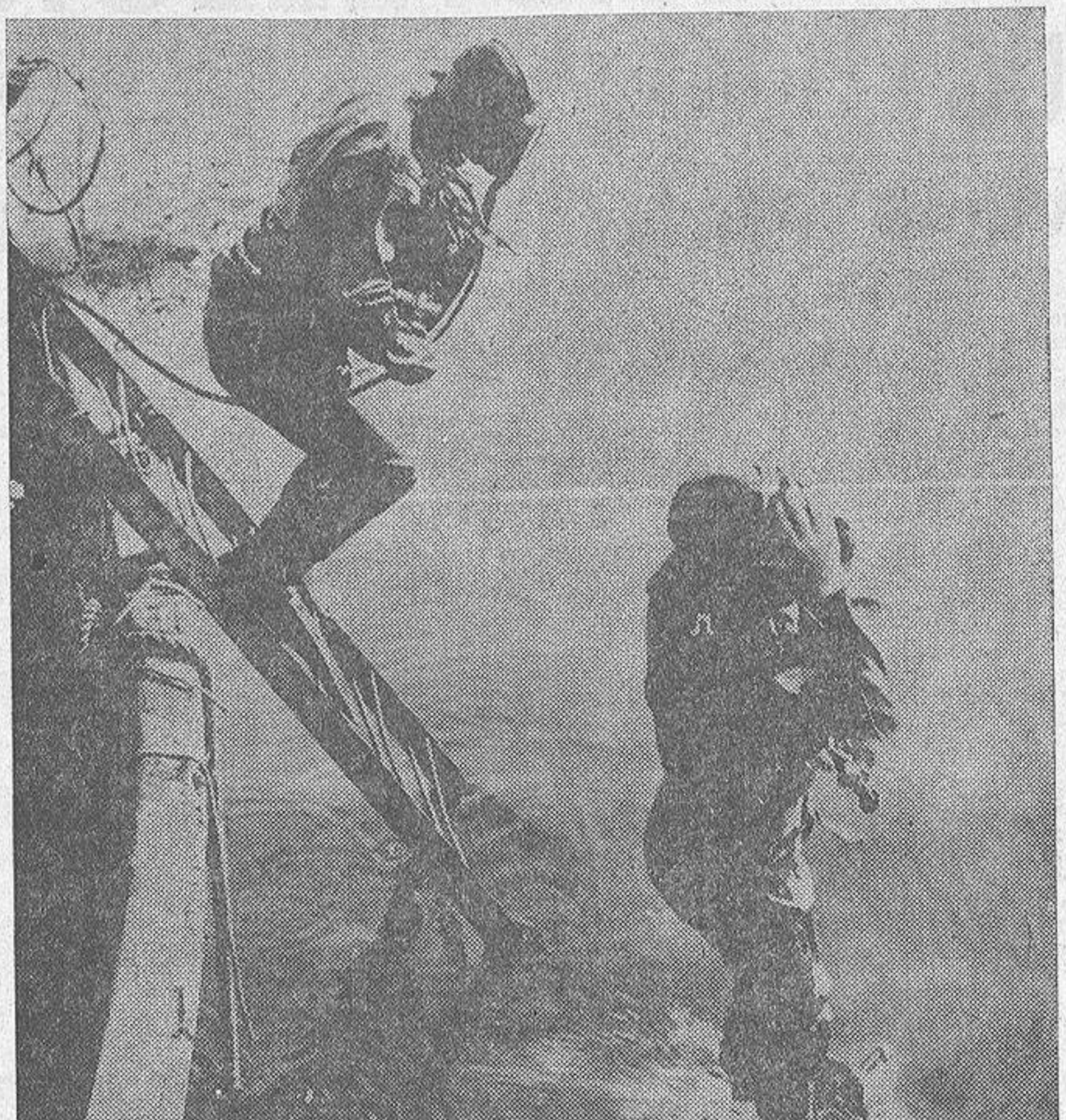
Los "hombres rana" saltan de la barca y se sumergen en el agua. ¿Será para encontrar un tesoro escondido o, por el contrario, para encontrar un escondite para un tesoro?

Los temores de la policía parecen estar justificados. Recientemente se juzgó en Inglaterra a cuatro hombres relacionados con un robo, a mano armada, por va-