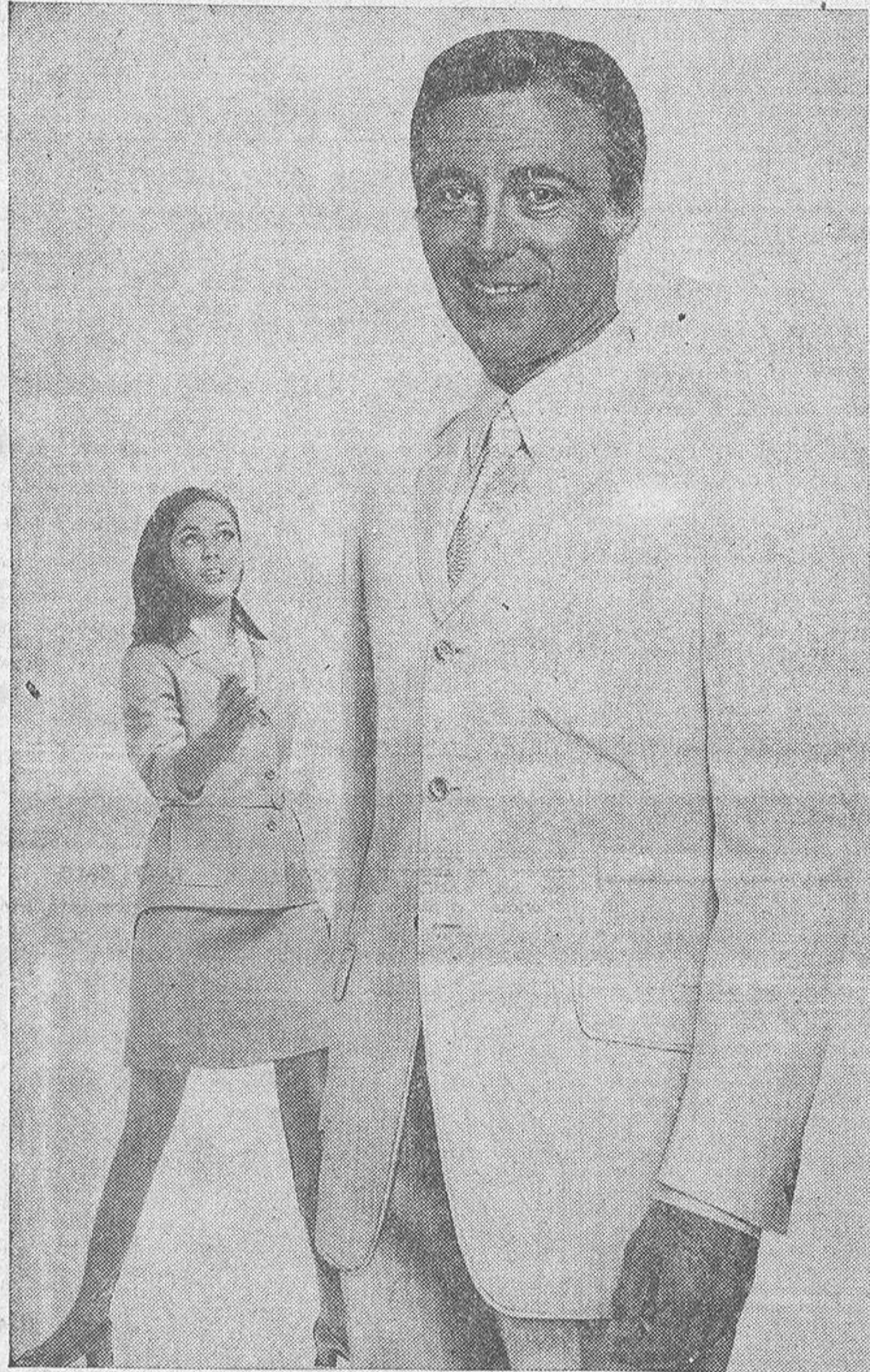
Aun cuando las revistas extranjeras publican, en ocasiones, anuncios tan sugerentes como el que reproducimos, la realidad es que, salvo excepciones, la sastretería en casi todos los países ha pasado a mejor vida. No faltan, empero, algunos como Italia que cuentan con unas magníficas confecciones en serie, que permiten a los habitantes de la península vestir casi a la medida.

Los hispanos nos preocupamos mucho de "vestir a la última", algo superado más allá de los Pirineos