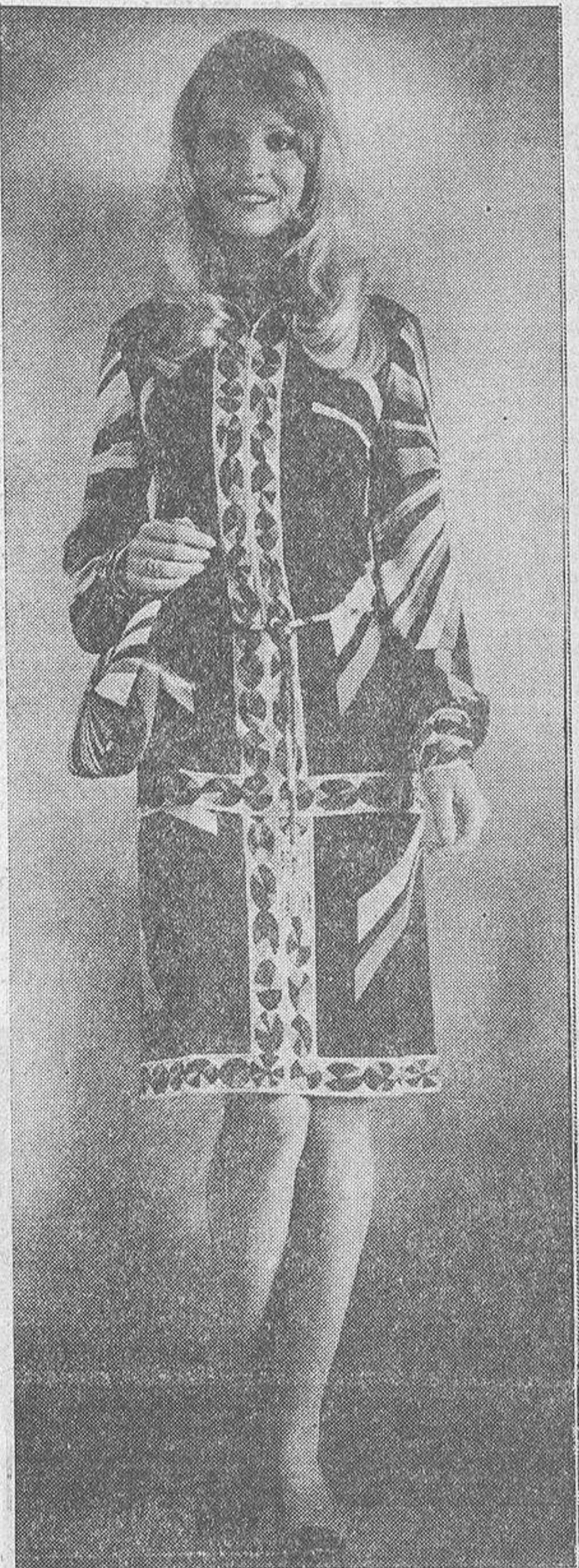
Si todas las señoras fueran tan esbeltas como esta maniquí, de seguro que mejoraría el carácter de numerosas féminas. El problema reside cuando una dama entrada en kilos se empeña en embutirse el modelito que le vio lucir a la muchacha escurrida de carnes. Los alemanes, eminentemente realistas en este terreno, parecen haber resuelto el problema al confeccionar modelos para mujeres gruesas.

Lo cierto es que los españoles seguimos viviendo demasiado para el exterior. A la inversa de los extranjeros, que viven para sí mismos. El sentido del ridículo, que tanto preocupa a las gentes celtibéricas, aparece superado, en buena parte, entre los foráneos. Conforme el espa-