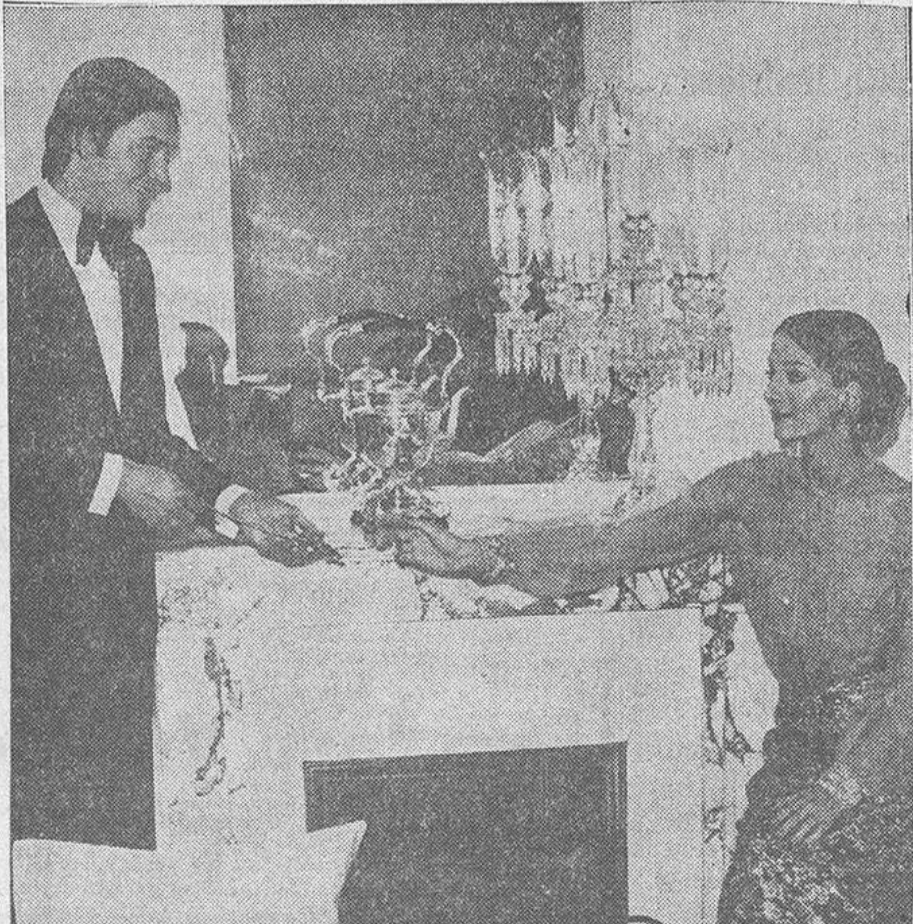
Si bien el matrimonio de la foto aparece vestido de tiros largos, como disponiéndose a cenar de gala en la intimidad hogareña, según hacen algunos ingleses, lo más probable es que el encargado de preparar los manjares haya sido el apuesto varón del traje de etiqueta. Como en casi todos los países europeos la mujer está empleada, el marido se ve obligado a trabajar mucho en las faenas de la casa. Algo que resulta totalmente inimaginable para cualquier esposo carpelovetónico.