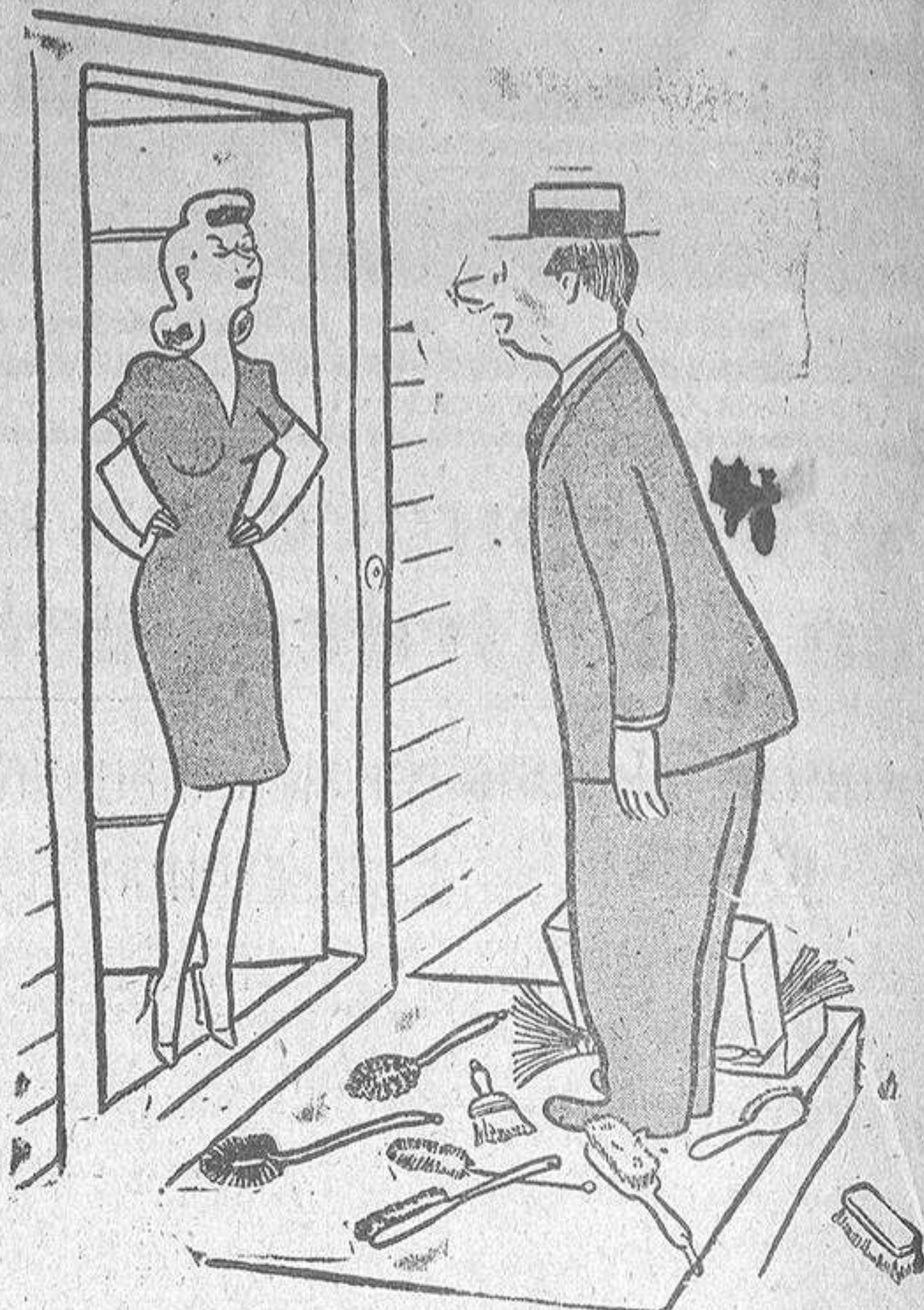
—DE MANERA QUE ERAS INGENIERO, ¿EH?

Este es el "pie" seleccionado entre el alud de soluciones interpretativas del dibujo que durante toda la semana cayó sobre el serio tribunal del concurso. Su autor puede pasar por nuestra Redacción, entre cinco y siete de la tarde para hacer efectivos los diez "pavos". Y a continuación publicamos otros "pies", reveladores de la gracia y el ingenio de nuestros lectores.