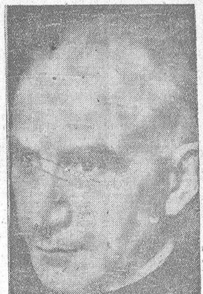
Excmo. y Rvdo. P. Angel Herrera Oria, Obispo de Málaga