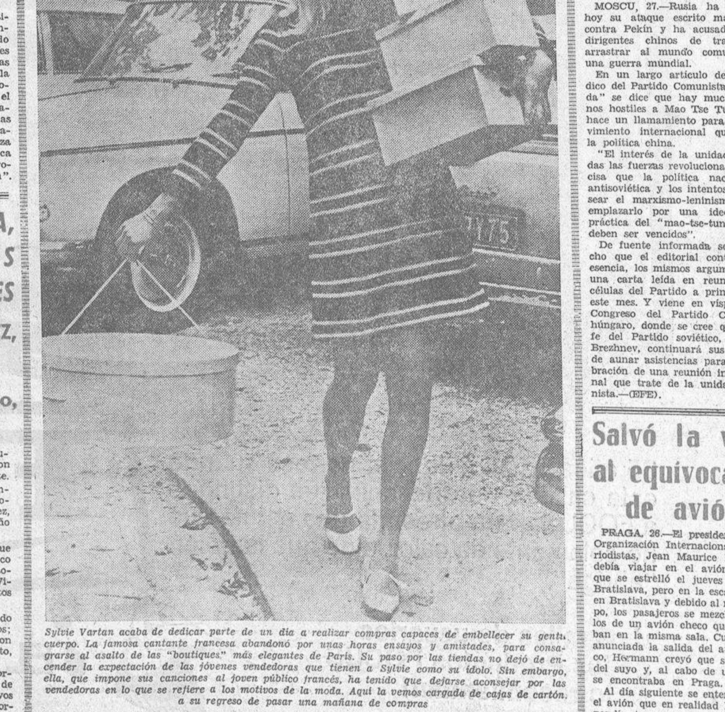
Sylvie Vartan acaba de dedicar parte de un día a realizar compras capaces de embellecer su gentío. La famosa cantante francesa abandonó por unas horas ensayos y amistades, para consagrar la expectativa de las jóvenes vendedoras que tienen a Sylvie como su ídolo. Sin embargo, ella, que impone sus canciones al joven público francés, ha tenido que dejarse aconsejar por las vendedoras en lo que se refiere a los motivos de la moda. Aquí la vemos cargada de cajas de cartón, a su regreso de pasar una mañana de compras.

MOSCU, 27.—Rusia ha lanzado hoy su ataque escrito más duro contra Pekín y ha acusado a los dirigentes chinos de tratar de arrastrar al mundo comunista a una guerra mundial. En un largo artículo del periódico del Partido Comunista "Pravda" se dice que hay muchos chinos hostiles a Mao Tse Tung y se hace un llamamiento para un movimiento internacional que anule la política china. "El interés de la unidad de todas las fuerzas revolucionarias precisa que la política nacionalista antisoviética y los intentos de falsear el marxismo-leninismo y reemplazarlo por una ideología y práctica del "mao-tse-tungismo", deben ser vencidos". De fuente informada se ha dicho que el editorial contiene, en esencia, los mismos argumentos de una carta leída en reuniones de células del Partido a principios de este mes. Y viene en vísperas del Congreso del Partido Comunista húngaro, donde se cree que el jefe del Partido soviético, Leonidas Brezhnev, continuará sus intentos de aunar asistencias para la celebración de una reunión internacional que trate de la unidad comunista.—(EFE).