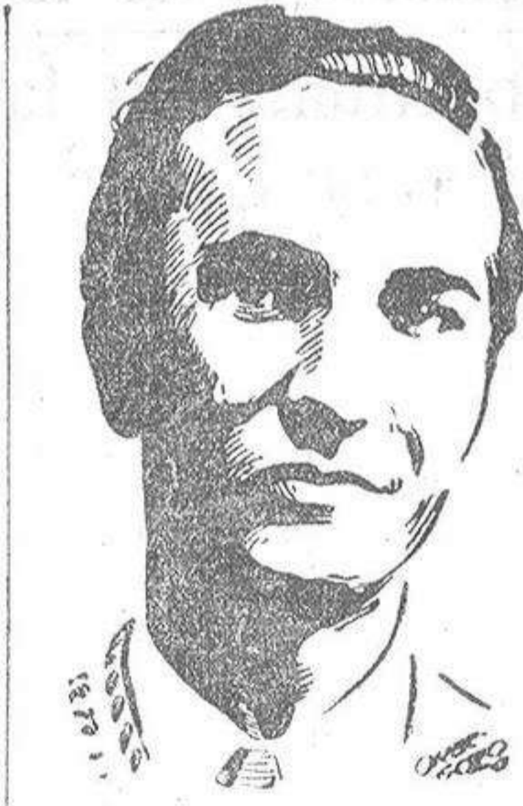
LUIS MIGUEL DOMINGUÍN

ce una faena con pases magníficos. Destacan varios naturales y otros por alto (ovación). Mata de una estocada en todo lo alto de la que rueda sin puntilla. (Ovación, dos orejas, rabo y pata).—CIFRA.