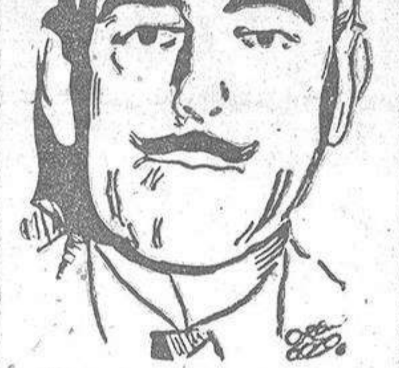
Dean Acheson, Subsecretario de Estado de Norteamérica

Una explicación de este debate en el Senado, incluyendo las declaraciones mencionadas más arriba fue publicada el 11 de febrero en varios periódicos americanos: "Washington Post", "The New York Herald" y otros, así como también por la Agencia United Press. El 14 de febrero el ministro de Asuntos Exteriores de la URSS, V. M. Molotov, dirigió al embajador de los Estados Unidos una nota en la cual se decía que el Gobierno soviético llamaba la atención del Gobierno de los Estados Unidos sobre la conducta de Mr. Acheson, quien, a pesar de su posición oficial, se permitió hacer en el Senado una declaración groseramente calumniosa e inamistosa hacia la Unión Soviética". (EFE).