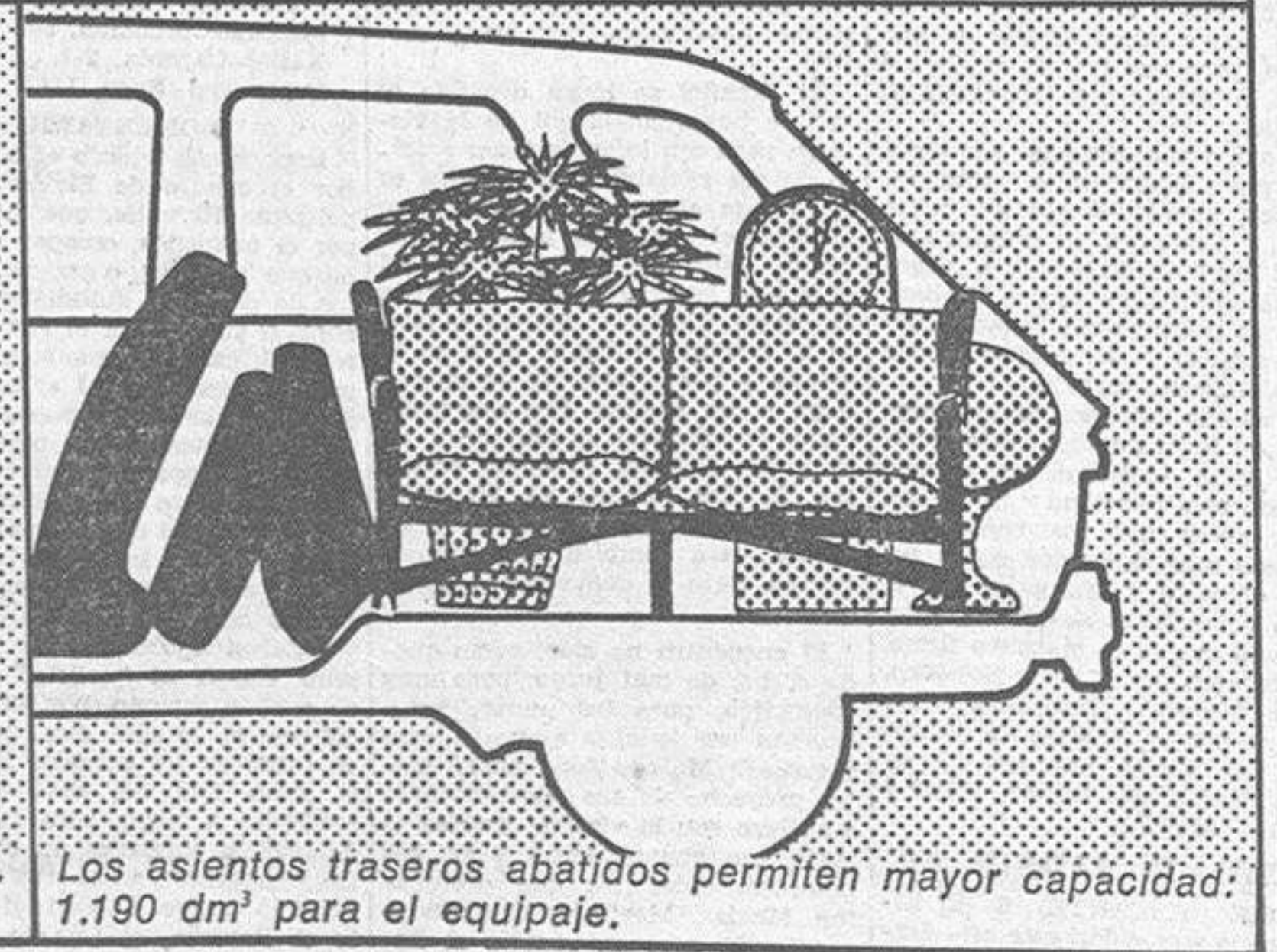
Los asientos traseros abatidos permiten mayor capacidad: 1.190 dm 3 para el equipaje.