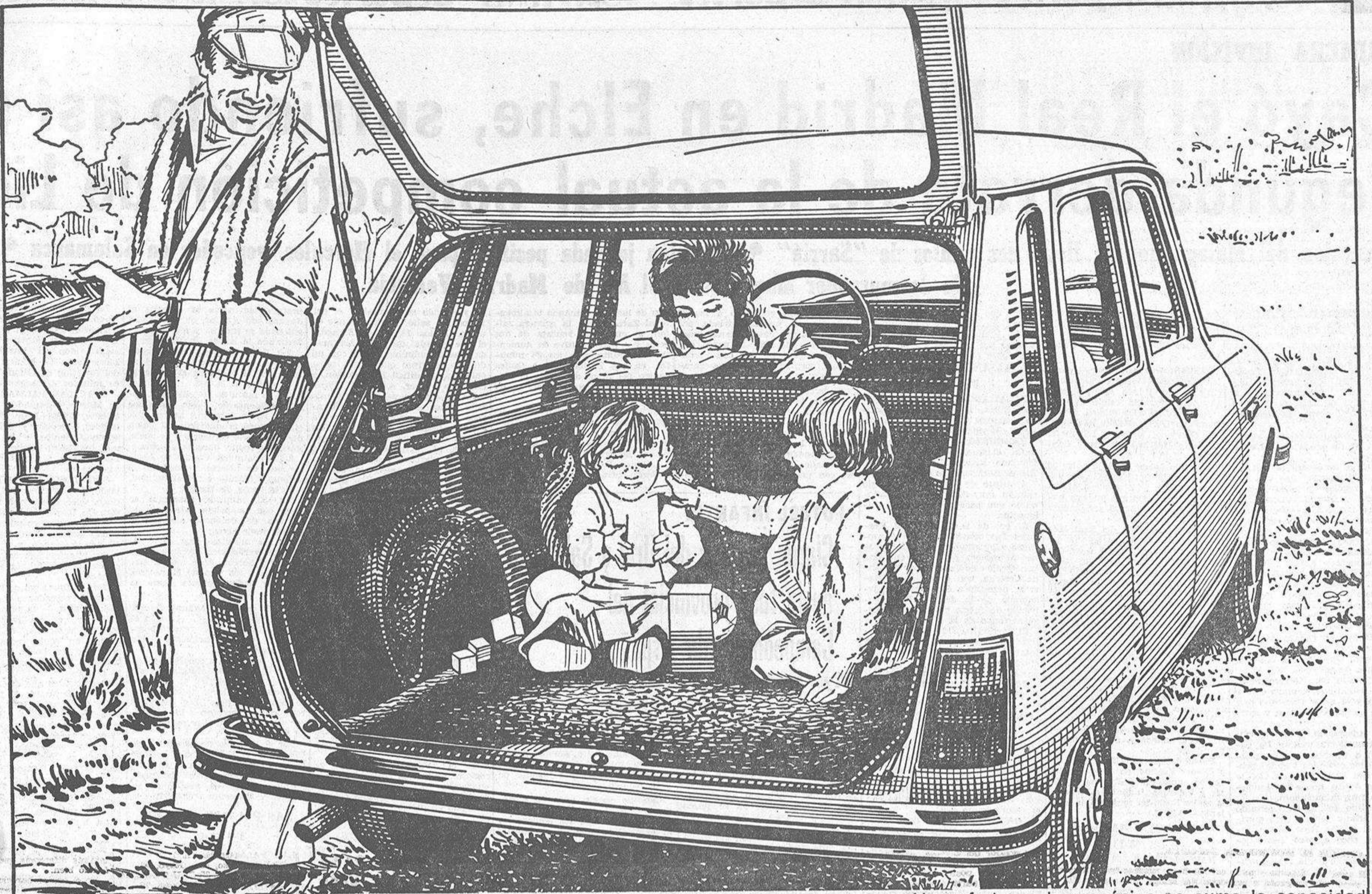
Al confort y a la mecánica se suma la capacidad