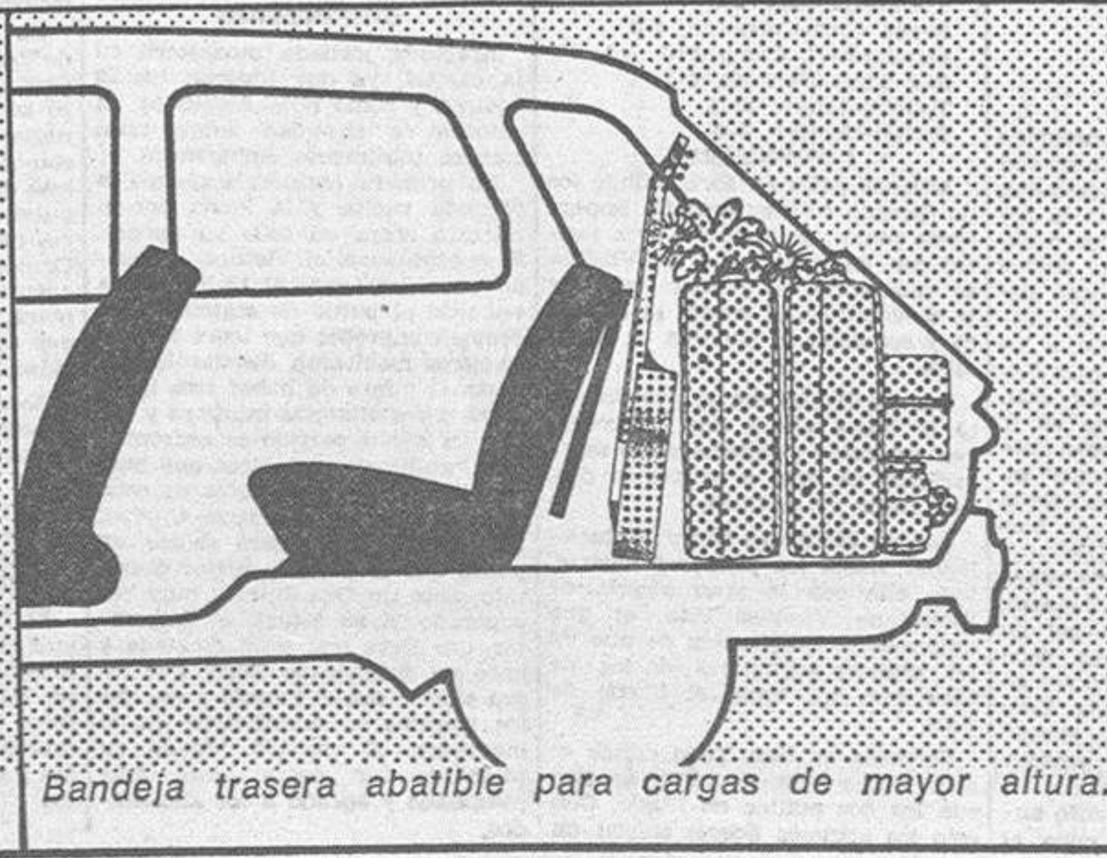
Bandeja trasera abatible para cargas de mayor altura.