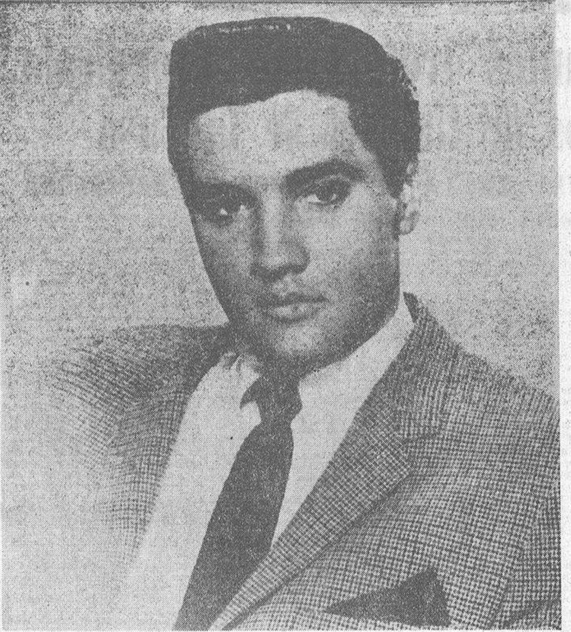
Elvis Presley cuando era el ídolo de los "bobby soxers", en los años cincuenta. Ahora, según sus allegados, sufre trastornos psicósomáticos.

EN junio de 1972, cien mil personas colmaron el Madison Square Garden en el debut neoyorquino del, sin embargo, veterano Elvis Presley. Por una vez casi se colaba el foso entre dos generaciones. En los graderíos de la inmensa sala, jóvenes de 13 a 15 años se unían a sus padres, para admirar al "ídolo" y "pionero" del "rock" de los 50. Bajo los reflectores, con su uniforme blanco y dorado y la guitarra al cuello, Elvis era el de siempre. Sólo desde muy cerca se notaba lo negro teñido de su pelo, la mayor flacidez de sus mejillas. Y, en todo caso, sus "viejos" ad-