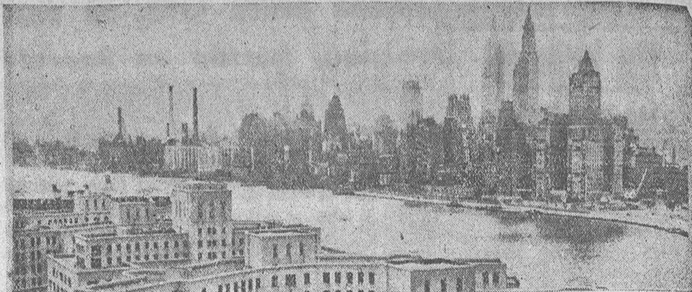
LOS DOS EDIFICIOS MAS ALTOS DEL MUNDO FRENTE A FRENTE

Los nuevos propietarios pagaron cincuenta millones de dólares