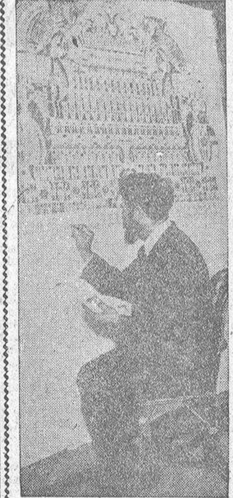
El francés Agustín Lesage era minero. Un día, de repente, cambio de vida. Dejó el pico y comenzó a pintar para obedecer, como él mismo ha declarado; a "las sugerencias de un espíritu-guía interior". Lesage se hizo pronto famoso en todo el mundo por sus cuadros y sobre todo por ciertas pinturas imaginativas sobre escenas de la vida del antiguo Egipto, en las que es acertada y exacta su correspondencia con la auténtica historia.

En estos últimos tiempos se han venido produciendo en Italia diversos actos de terrorismo, que culminaron recientemente con la colocación de artefacto incendiarios en el interior de la Basílica de San Pedro.—(EFE).