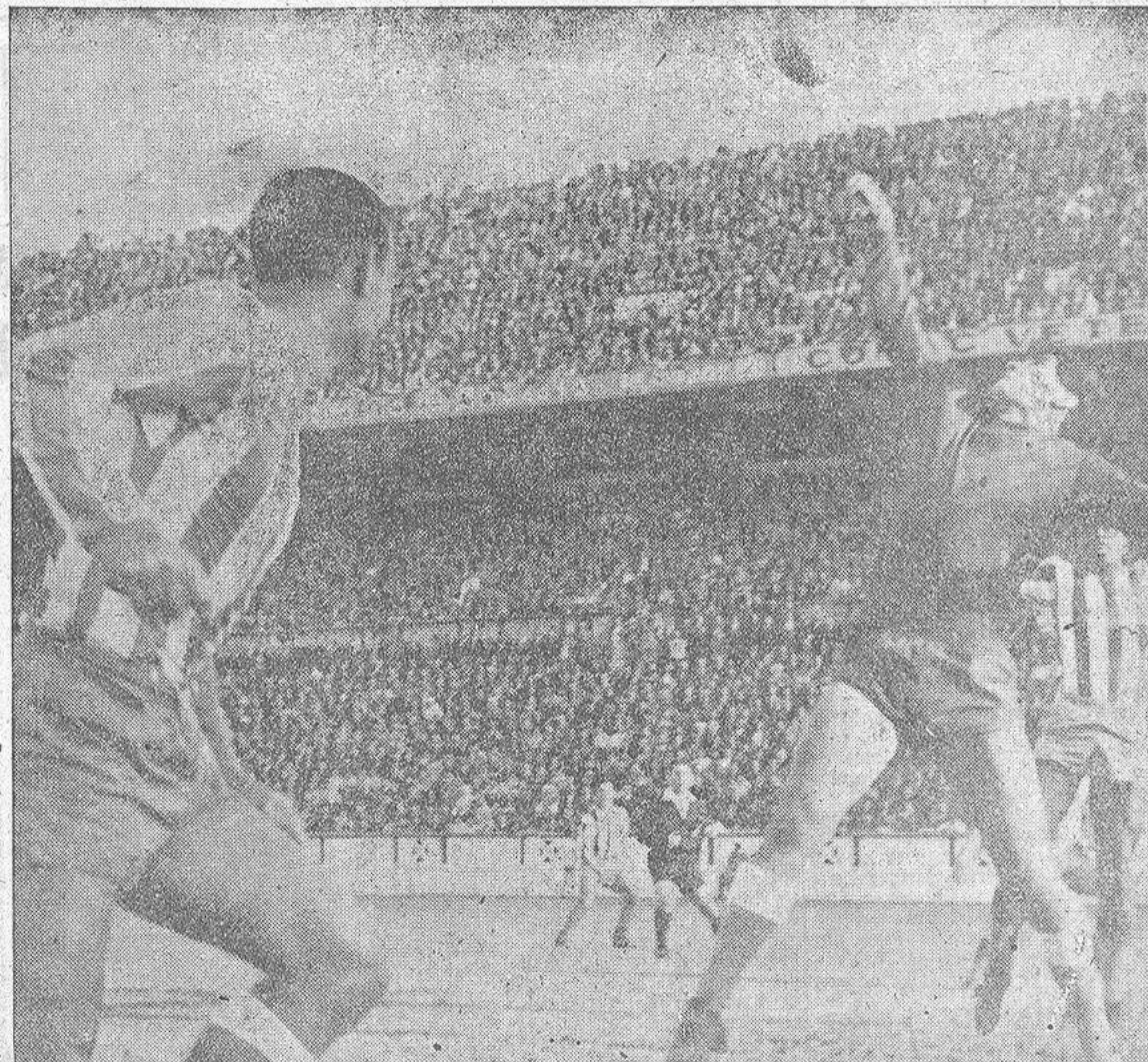
Día de gala en el estadio de Riazor, casi lleno de público en una tarde soleada y con un ambiente de expectación ante la calidad del visitante de turno. El encuentro respondió al interés suscitado. Hubo buen juego, emoción y aún bronca para el juez de la contienda, que tuvo una actuación marcadamente partidista en favor de los "colchoneros". El Atlético dejó constancia de su gran clase y depurada técnica, pero ello no le bastó para vencer a un Deportivo que ahora sabe desmelenarse y jugarle de "tú a tú" a los más grandes rivales. Incluso pudo haber vencido, si el pitido final del encuentro se hubiera retrasado apenas unos segundos. Pero un empate frente a los "gallitos" del grupo tampoco es mal resultado. Antes del encuentro muchos lo hubieran firmado. En la fotografía, una de las espléndidas intervenciones de Padrón, gran figura del encuentro.