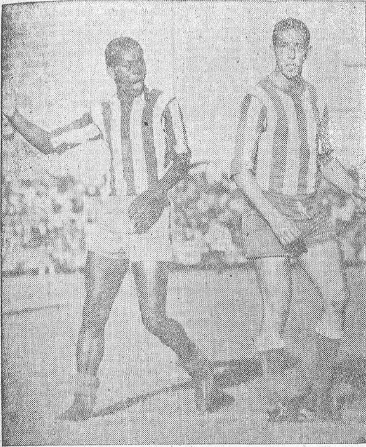
El extremo rojiblanco Jones y el defensa blanquiazul Dominguez mantuvieron durante los 90 minutos del partido un noble duelo que se resolvió finalmente a favor del defensa coruñés. Aquí vemos una de las numerosas ocasiones en que defensa y extremo discuten por la posesión del balón

Antes de hacer referencia a los agnósticos conviene mencionar al protagonista. Dicho se está que el protagonista fue el árbitro, don José Ruiz Casasola, en quien resulta difícil averiguar y analizar la intención. El señor Ruiz lo fue ayer todo menos "casero". Perjudicó considerablemente al Deportivo en cuatro ocasiones resolutivas, y uno no es capaz de desentrañar si lo hizo con la respetable intención de no frustrar la ya brillante carrera del Atlético de Madrid en la presente Liga o a causa de una evasión de ciertos componentes de su intelecto.