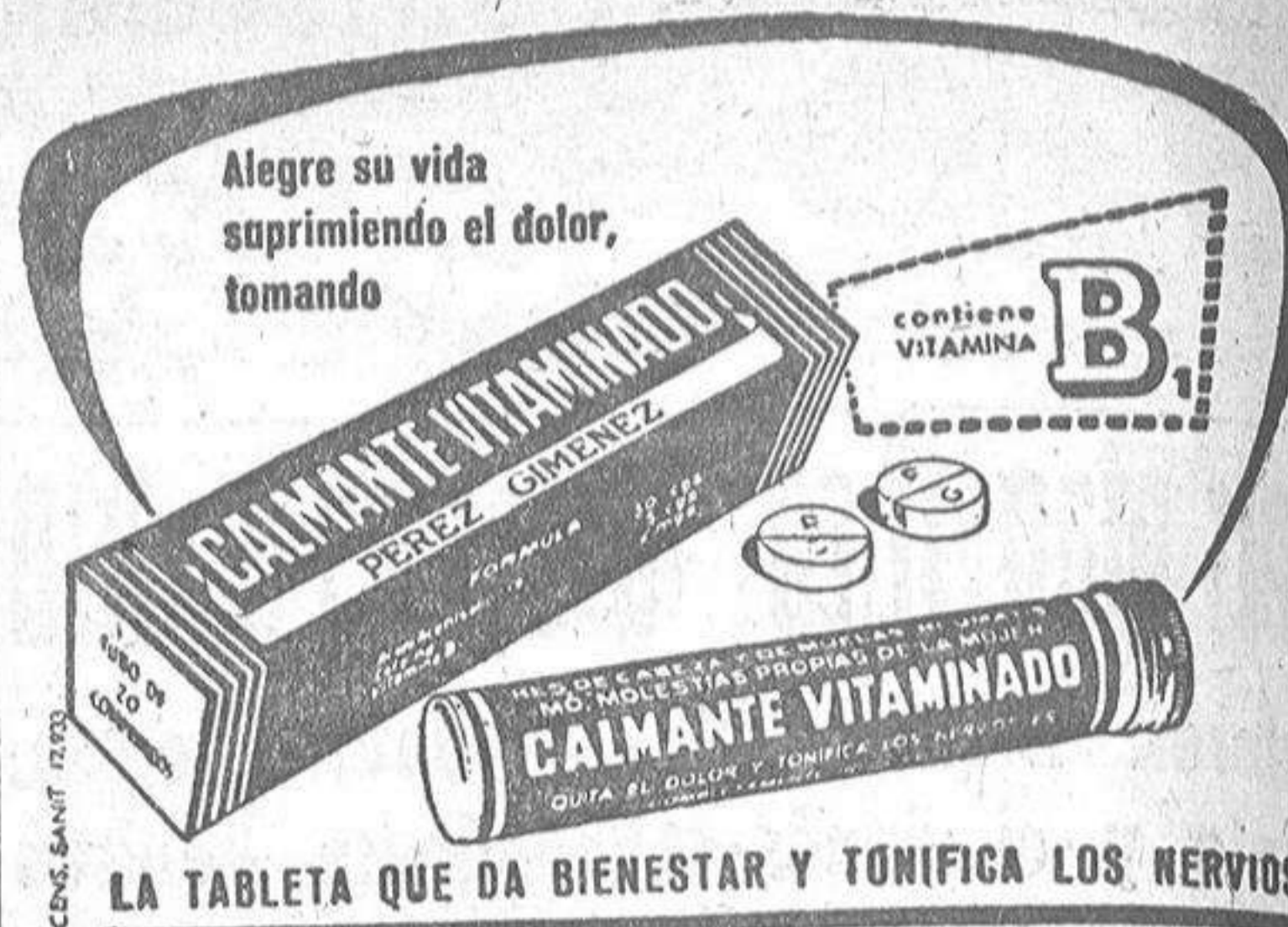
LA TABLETA QUE DA BIENESTAR Y TONIFICA LOS NERVIOS.