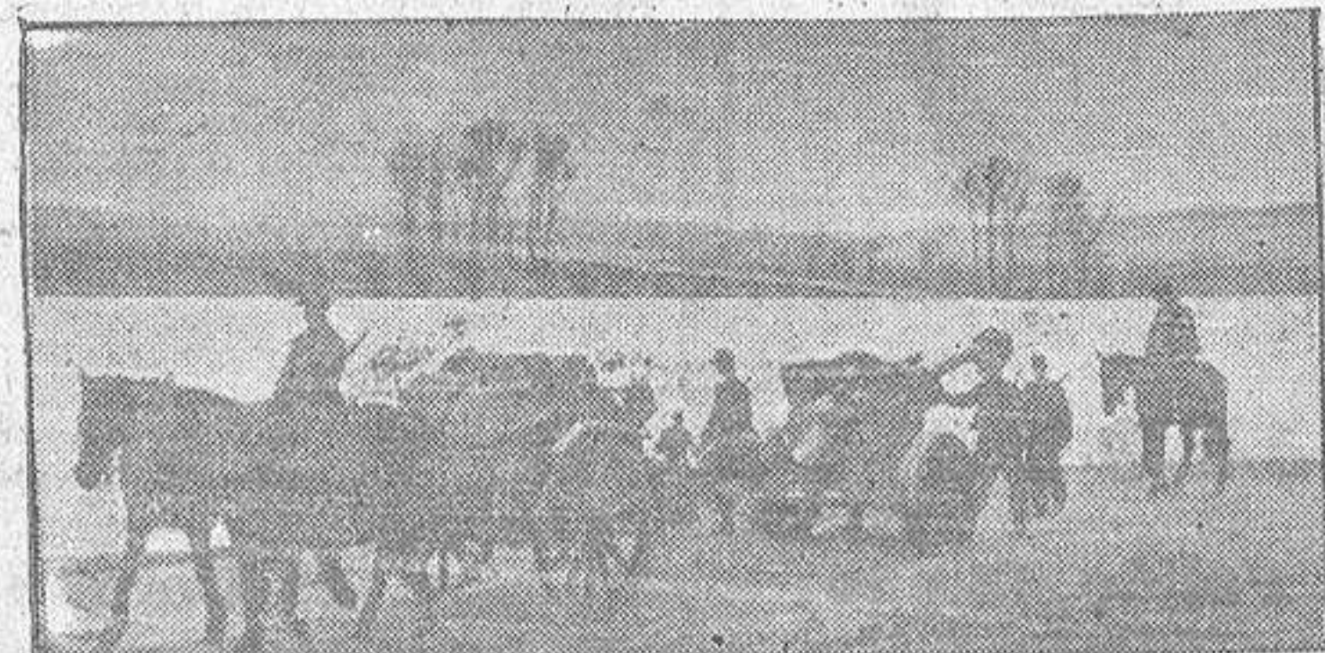
Poco a poco amanece. Como una ancha cinta de plata brilla el río bajo los rayos del sol naciente. Una batería de morteros se dirige a primera línea