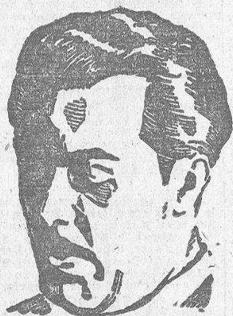
Camarada José Antonio Girón, Ministro del Trabajo