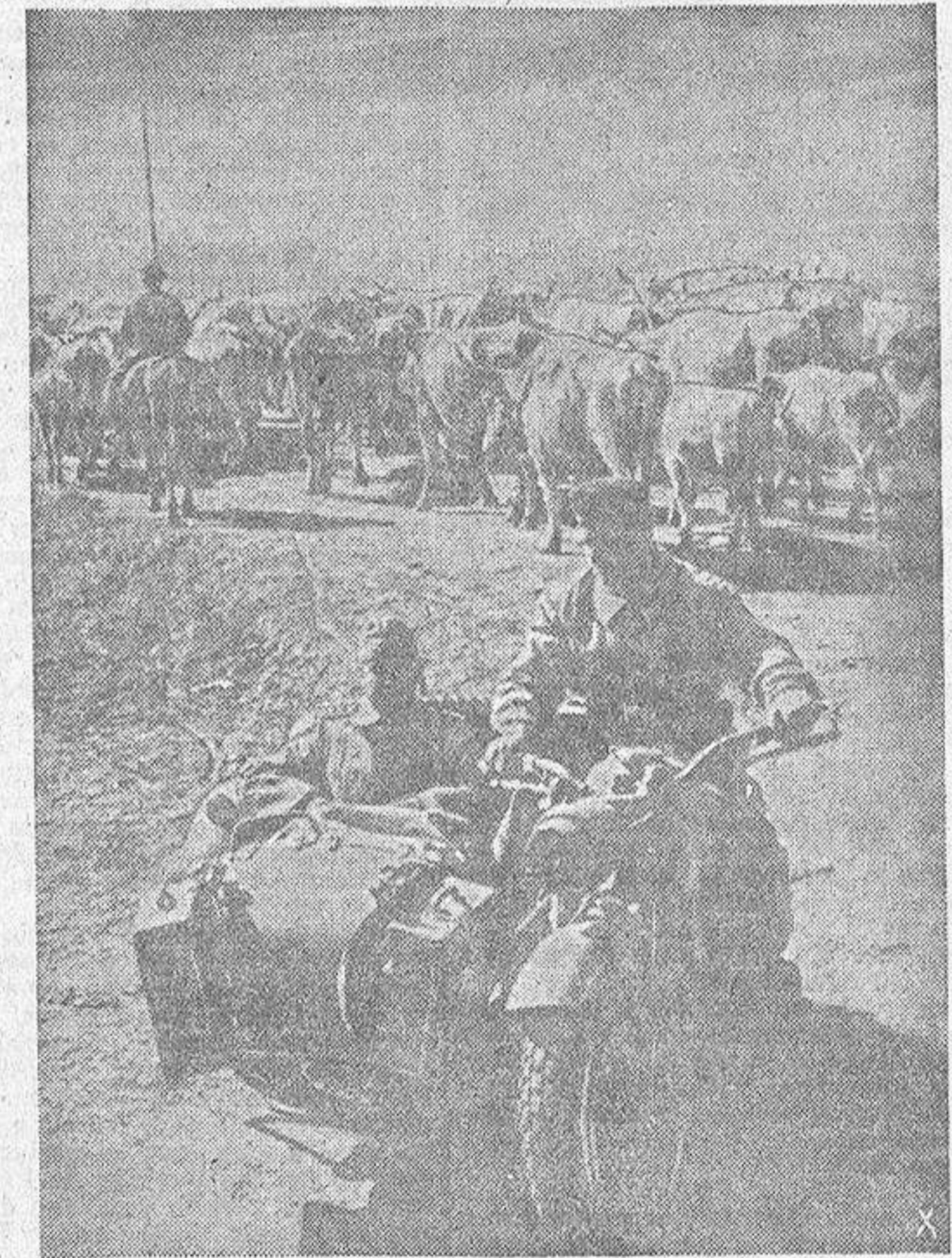
Junto con las tropas, la población civil rusa, evacúa las poblaciones. Las instalaciones militares son destruidas antes de ser abandonadas. La población civil rusa se dirige hacia las líneas de defensa alemanas conduciendo su rebaño