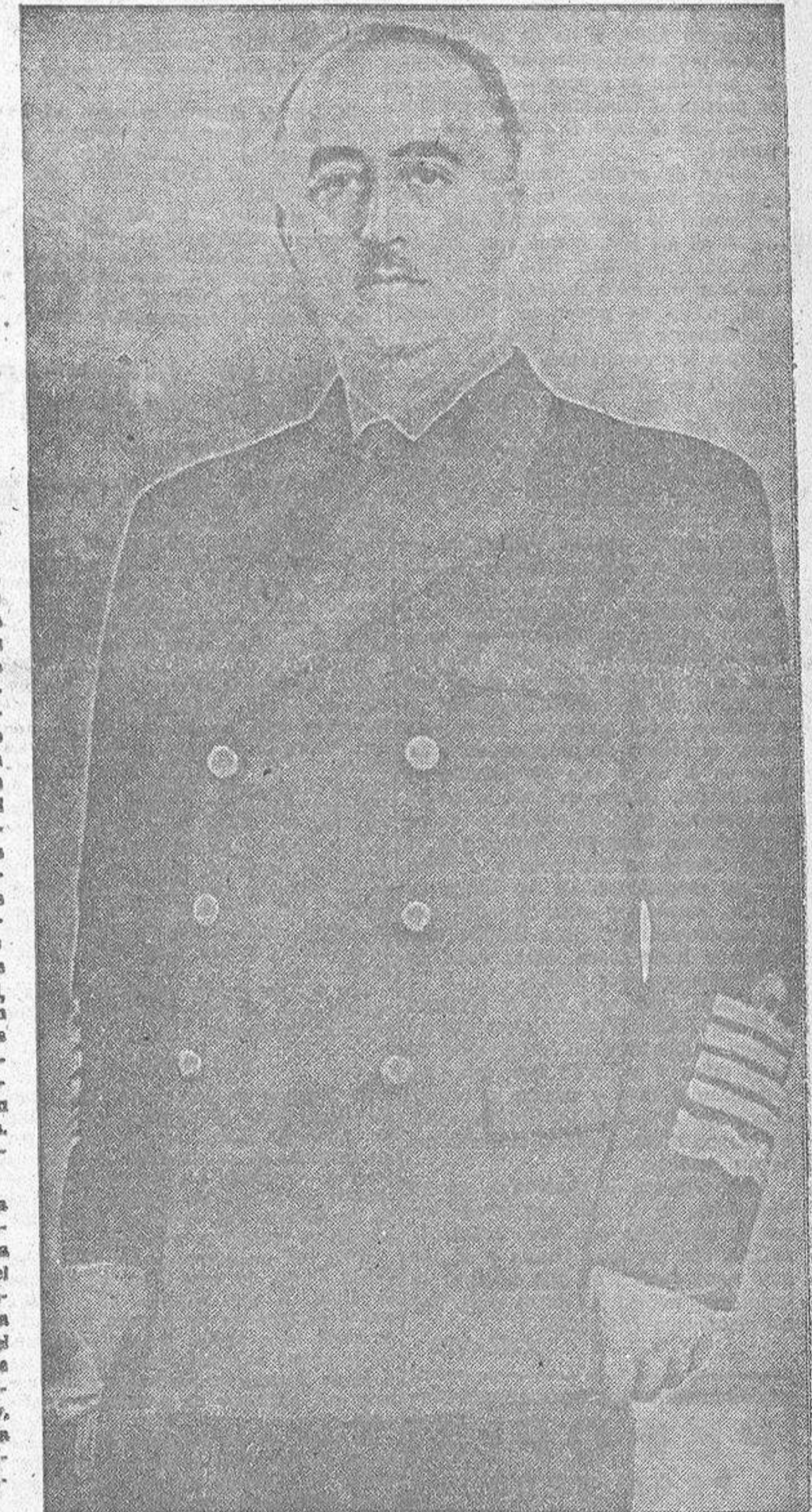
BAJO EL CAUDILLAJE Y EL SIGNO VICTORIOSO DE FRANCO, HA SIDO INAUGURADA LA ESCUELA NAVAL MILITAR DE MARIN, UNA DE LAS MEJORES DEL MUNDO, ESPAÑA VOLVERA A LAS RUTAS HEROICAS Y GLORIOSAS DEL MAR. POR FRANCO. Y GALICIA SIENTE EL LEGITIMO ORGULLO DE QUE ESTE ESPLENDIDO RESURGIMIENTO NAVAL SE DEBA AL MAS PRECLARO DE SUS HIJOS