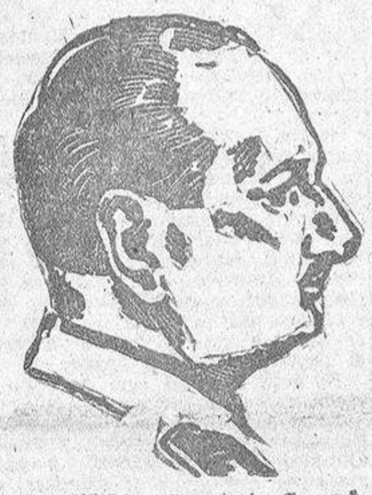
El Ministro Secretario General del Partido, camarada Arrese

En nombre del Caudillo, el Ministro-Secretario del Partido clausuró la XXI Feria de Muestras Internacional