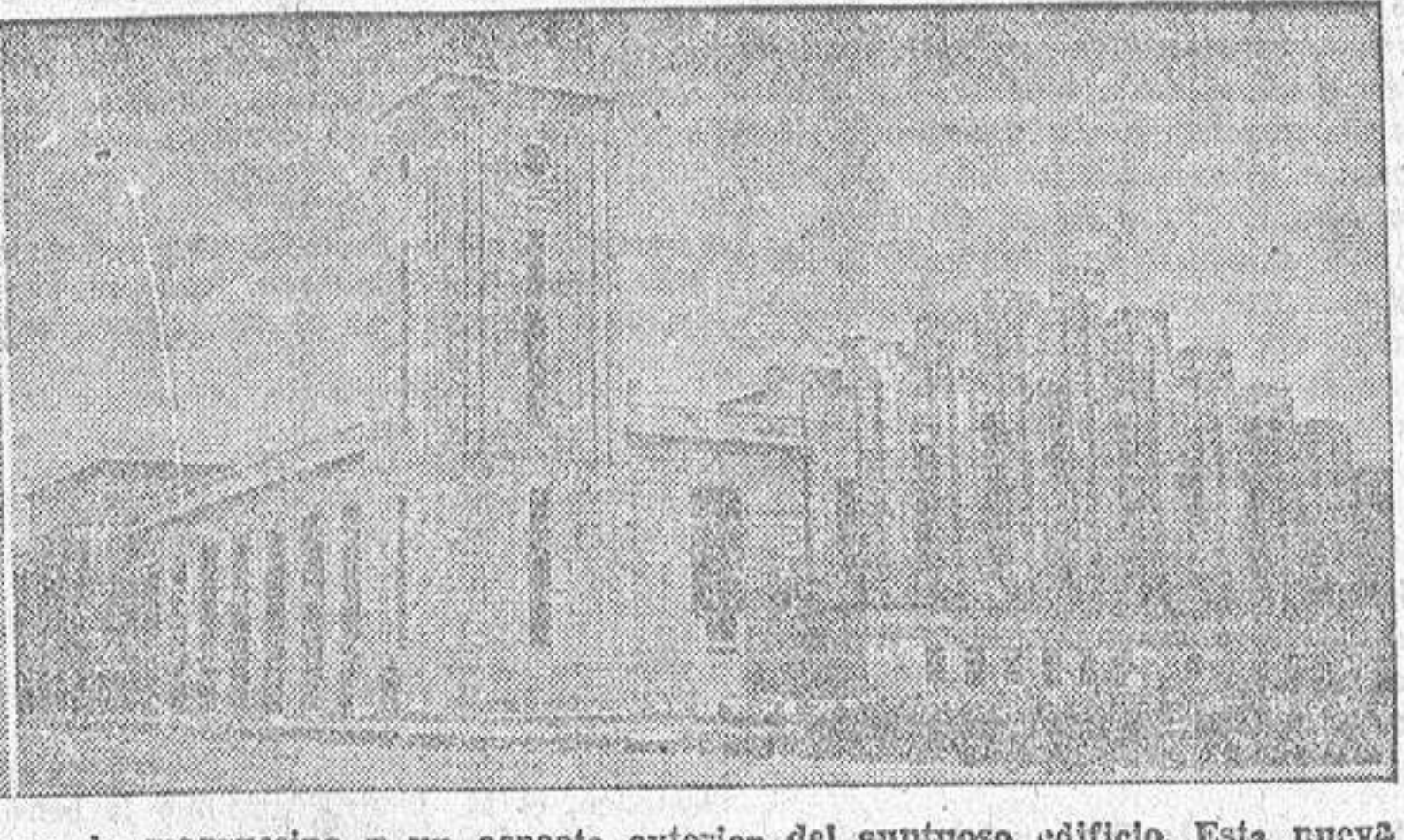
Vista general de la estación coruñesa del Ferrocarril a Santiago. Los andenes, la marquesina y un aspecto exterior del suntuoso edificio. Esta nueva vía férrea, de tan vital interés para Galicia, será inaugurada en la actual semana.

El Ferrocarril a Santiago y el Puente del Pedrido serán inaugurados esta semana