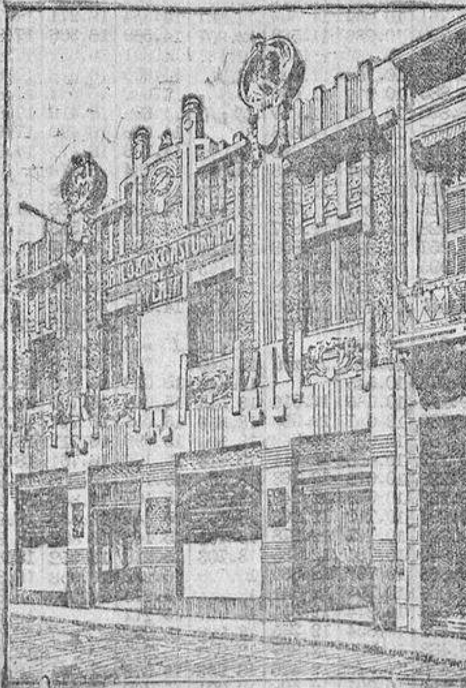
EDIFICIO DEL BANCO

Los grandes Mercados del Plata consumen anualmente del Extranjero productos por valor de 500 millones de pesos oro, y de España sólo 14.