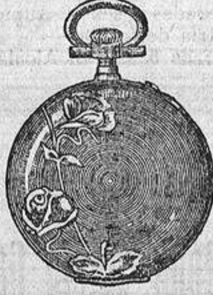
N.º 3. Las Rosas