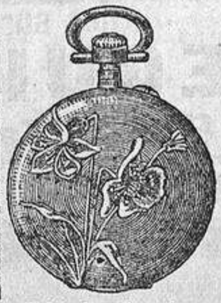
N.º 1. Los Narcisos