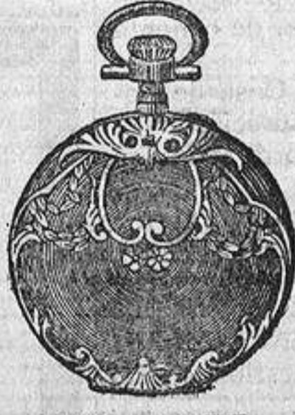
N.º 4. Luis XV