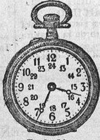
N.º 2. Liso