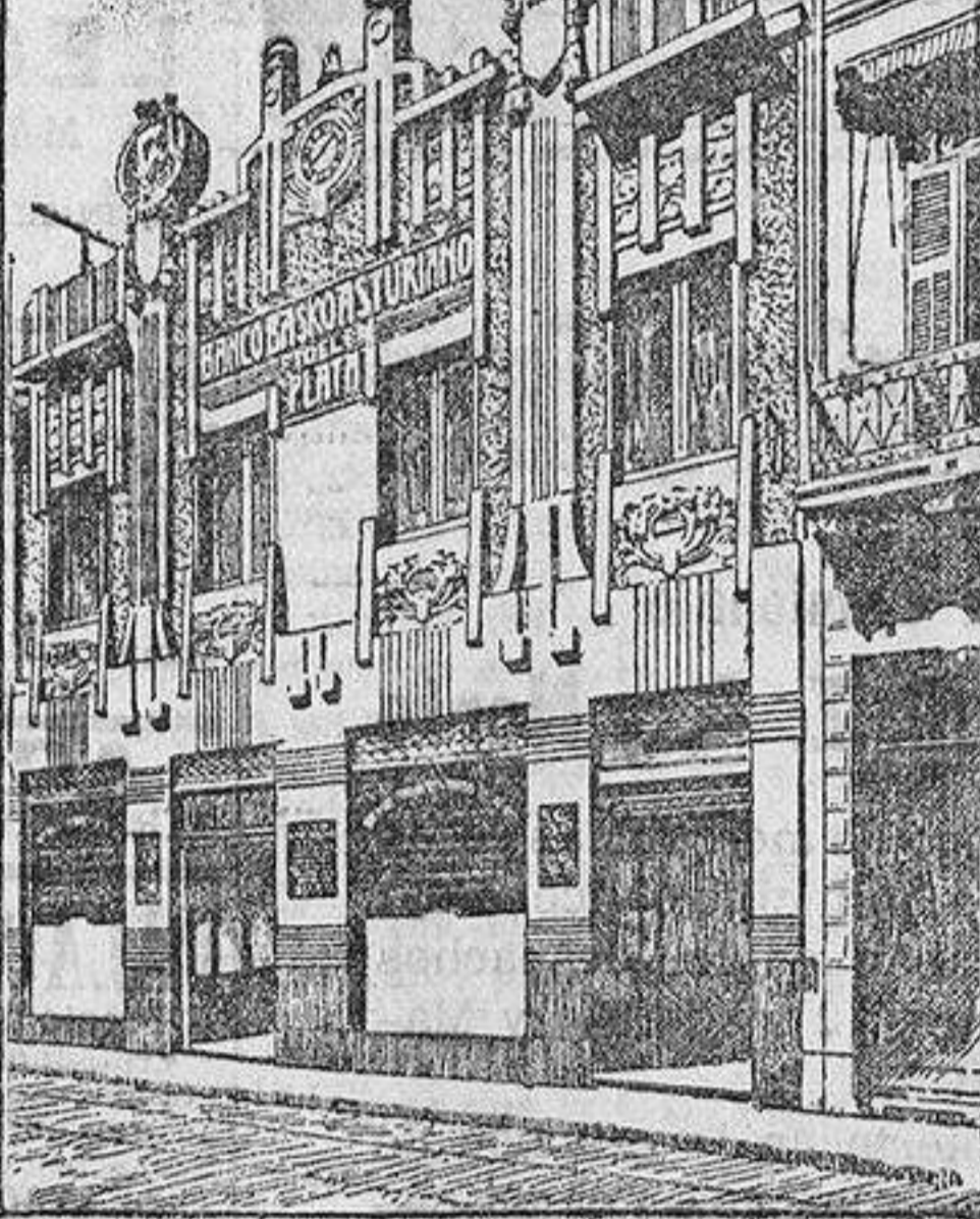
EDIFICIO DEL BANCO

Los grandes Mercados del Plata consumen anualmente del Extranjero productos por valor de 500 millones de pesos oro, y de España sólo 14.