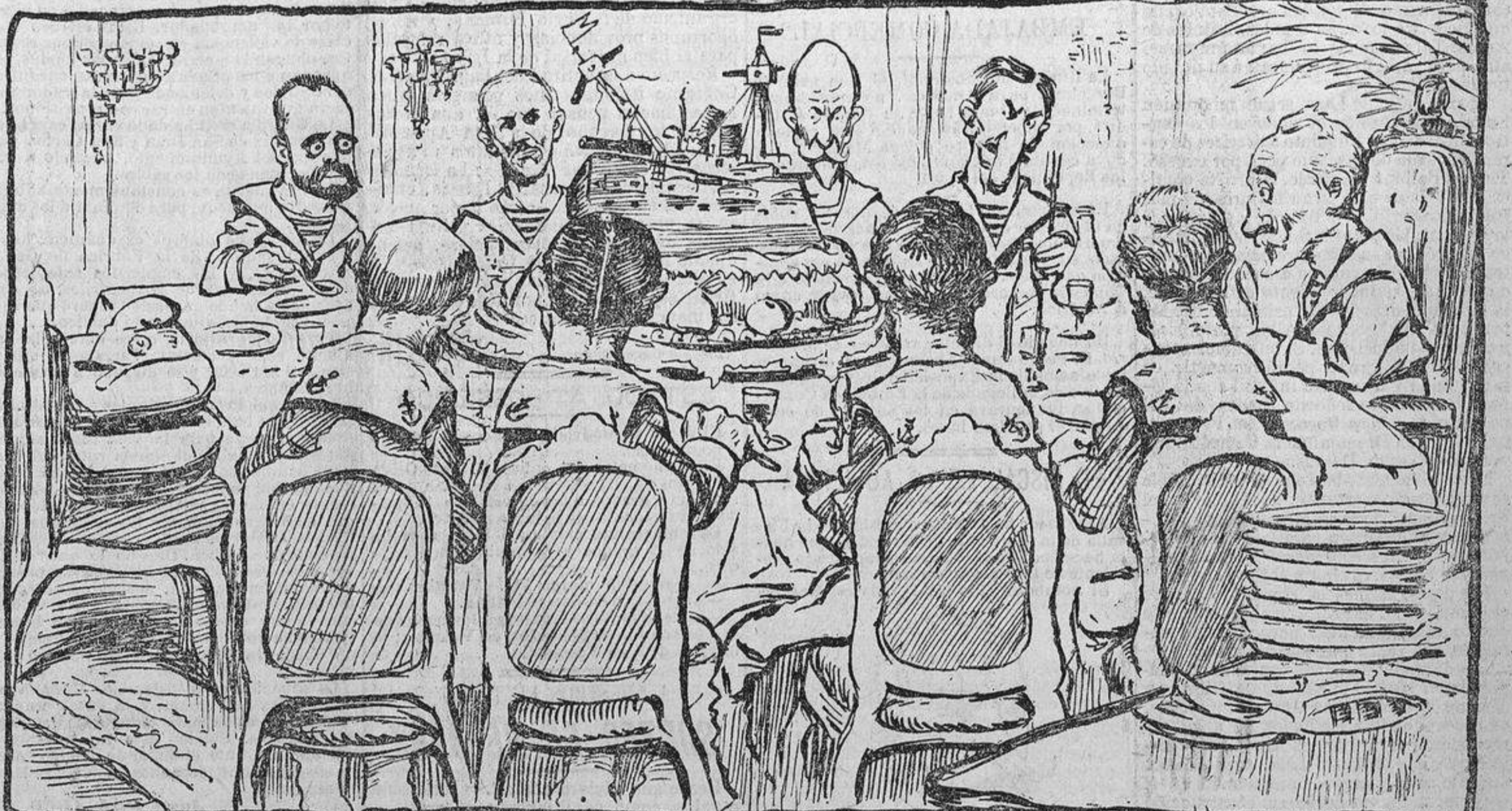
EL ANFITRION.—Mi repostero ha querido conmemorar los acuerdos...