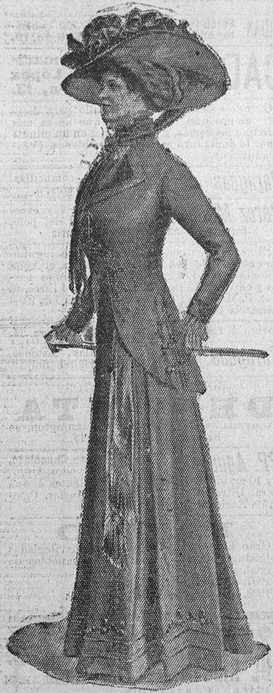
BLUSAS Y VESTIDOS DE CALLE

Chaquet paño con bordados ó trencillas de un punto más oscuro que el tono de la tela.—Vivos de terciopelo del mismo tono.—Domina el tono gris ó marrón.