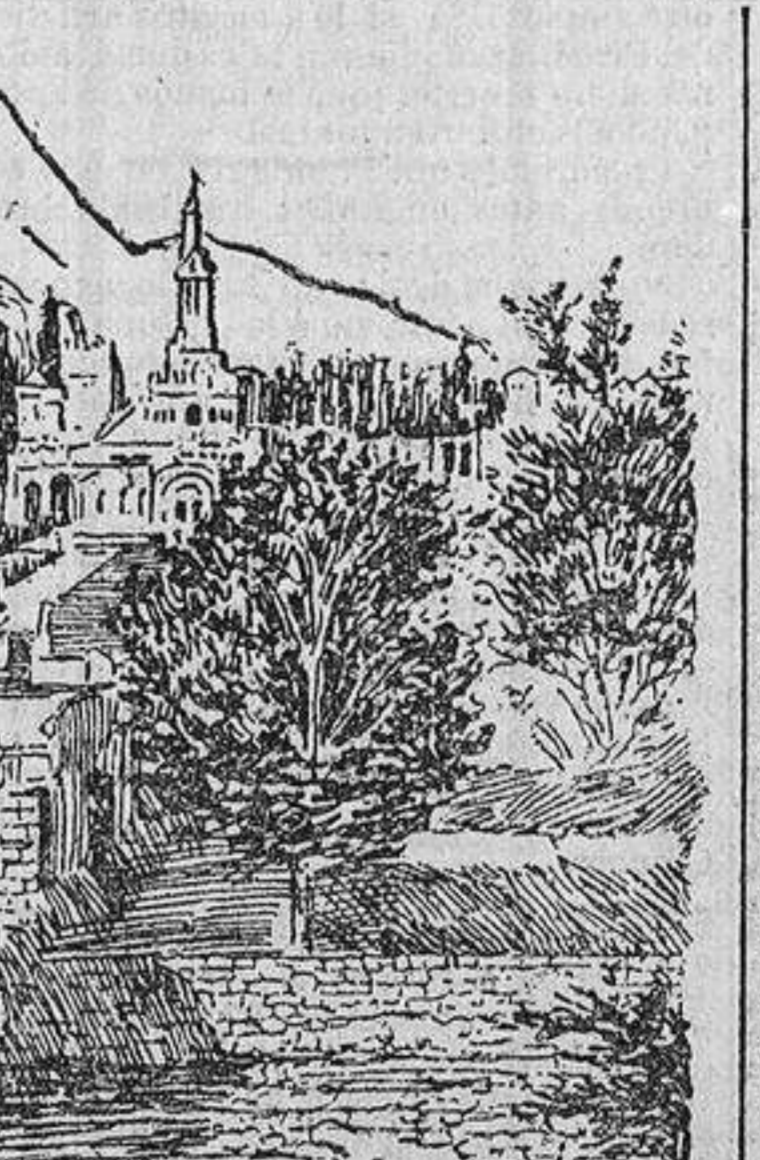
LOS GEMENTERIOS CERRADOS Un negocio.