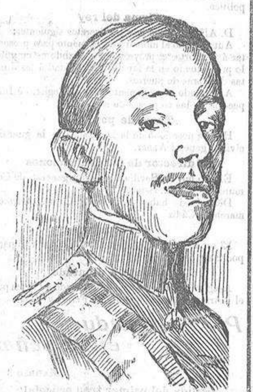
S. M. el Rey que hoy llegará á Ferrol para presenciar la botadura