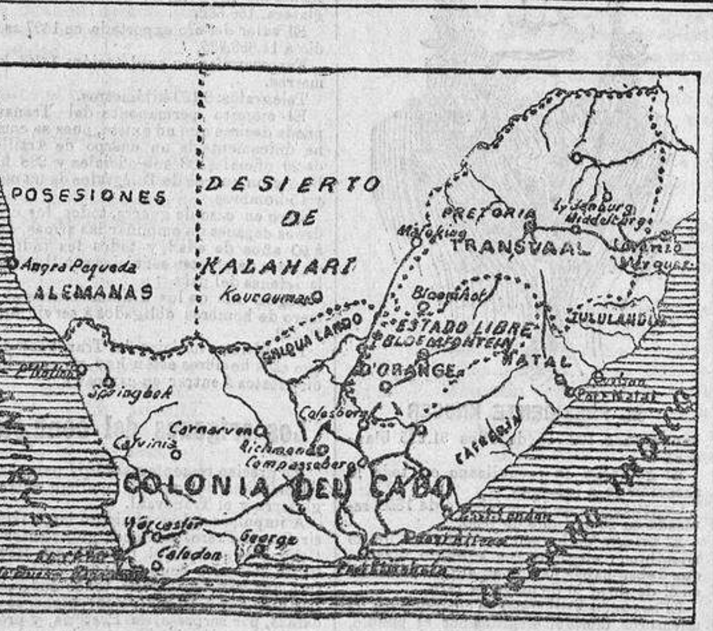
PLANO DEL TRANSVAAL Y TERRITORIOS LIMÍTROPES

Siendo indispensable la ofensiva—dice el escritor aludido—la invasión del territorio de los boers tendrá que hacerse por Lange Neck. La bahía de Delagoa sería una base preferible y el camino más corto; pero como pertenace a Portugal, sin un acuerdo con otras naciones, cosa poco probable, no será posible utilizarla. El camino más largo cruzando Natal, tiene la ventaja de la línea férrea que ya hasta la misma frontera, via importantísima para el transporte y suministro de las tropas que son los factores