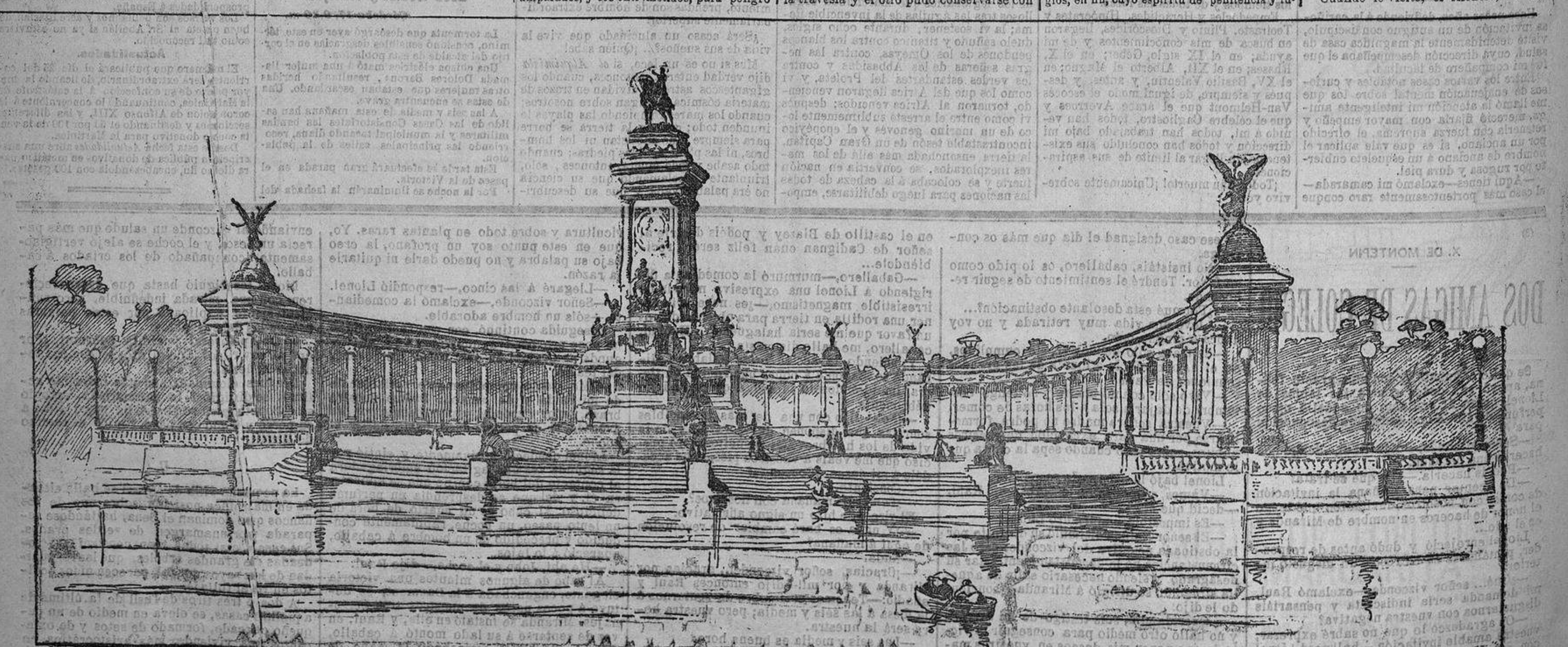
MONUMENTO Á ALFONSO XII