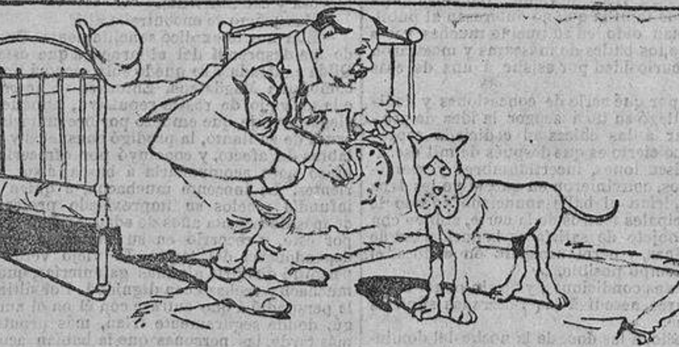
—Ya lo sabes, Cain; en cuanto dén las ocho, tiras del cordelito. ¿Oyes?