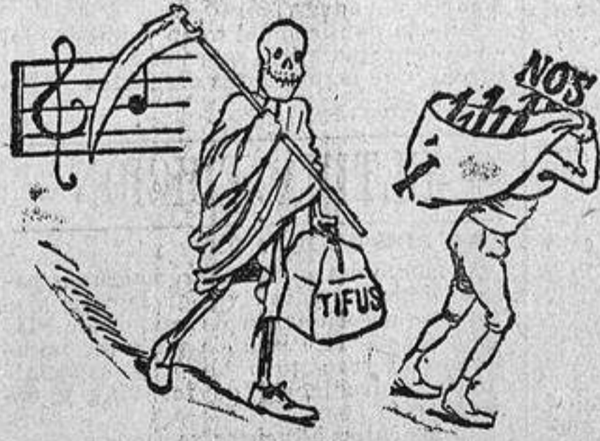
SOLUCION DEL ANTERIOR

DE SENECA. Todo lo debemos consultar con el amigo; mas primero debemos consultar si lo es.