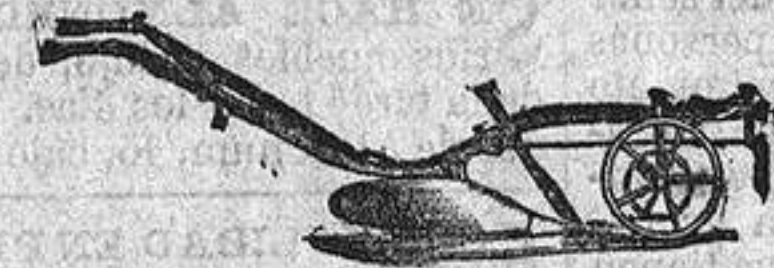
ARADOS PARA CABALLOS, DOS MULAS ó BUYES.