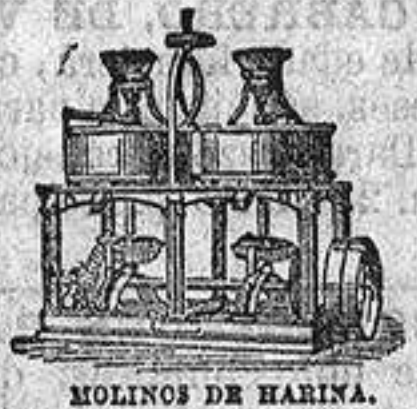
MOLINOS DE HARINA.