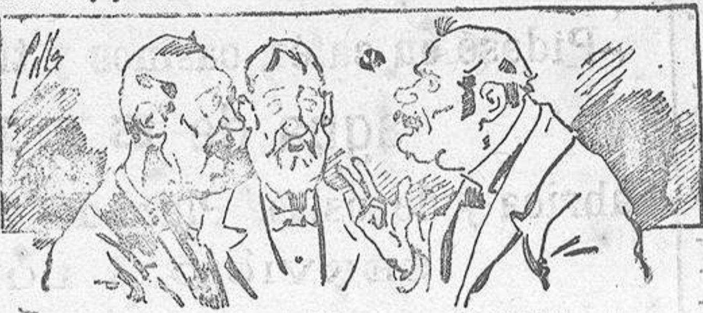
Abomianan á nuestros libros..... pero los compran.

Todas las personas de gusto, curiosas ó ilustradas deben pedir al Director de LA AVISPA, apartado núm. 8, MADRID, un ejemplar que se remite gratis y franqueado. Esta Revista Enciclopédica Popular publica recreaciones científicas, recetas de cocina, repostería, confitería, vinos, licores, pinturas, barnices, betunes y fórmulas para toda clase de industria, y cuantas noticias y conocimientos puedan ser beneficiosos. Cuenta además con buenos grabados, parte literaria excelente; da regalos mensuales á sus lectores con la Lotería Nacional y participaciones en la misma, á cuyo efecto compra todos los sorteos, y en una de las Administraciones más afortunadas por la suerte, billetes enteros. La suscripción y los números que se nos pidan se sirven gratuitamente á correo vuelto y franqueados, con sólo indicar el nombre y dirección del que lo desea en sobre dirigido al Sr. Administrador de