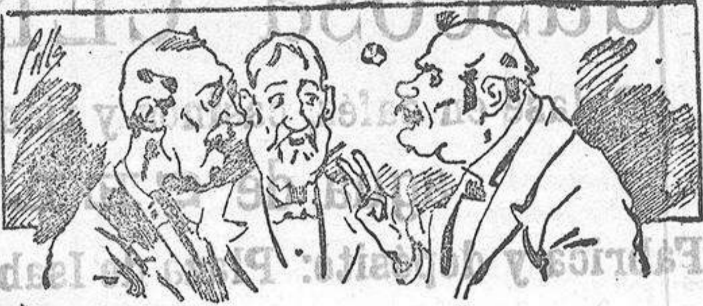
Ahorran á nuestros libros..... pero los compran.

Formulas para toda clase de industria, y cuantas noticias y conocimientos puedan ser beneficiosos. Cuenta además con buenos grabados, parte literaria excelente; da regalos mensuales á sus lectores con la Lotería Nacional y participaciones en la misma, á cuyo efecto compra todos los sorteos, y en una de las Administraciones más afortunadas por la suerte, billetes enteros. La suscripción y los números que se nos pidan se sirven gratuitamente á correo vuelto y franqueados, con sólo indicar el nombre y dirección del que lo desea en sobre dirigido al Sr. Administrador de