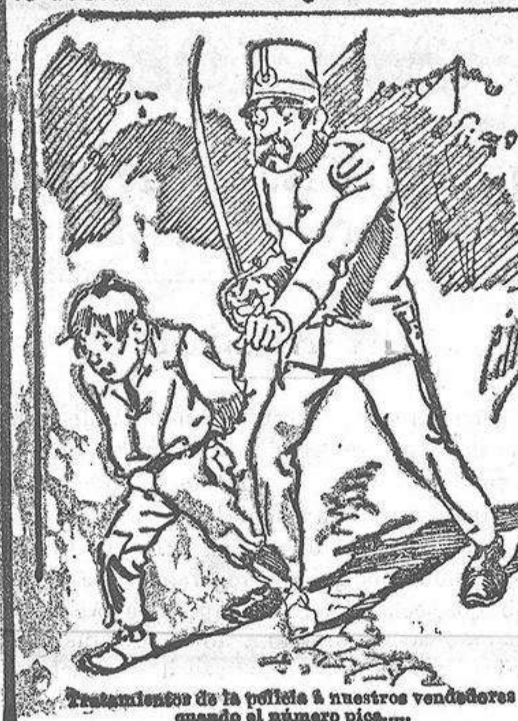
Tratamiento de la polifolia á nuestros vendedores cuando el número pica.....

También puede pedirse LA AVISPA y el CATALOGO RESERVADO en casa de nuestros corresponsales autorizados, si no se quiere escribir á la Administración.