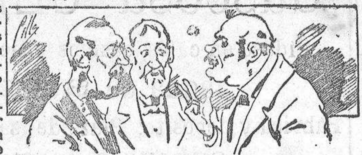
Abominan á nuestros libros....., pero los compran.

Todas las personas de gusto, curiosas é ilustradas deben pedir al Director de LA AVISPA, apartado núm. 8, MADRID, un ejemplar que se remite gratis y franqueado. Esta Revista Enciclopédica Popular publica recreaciones científicas, recetas de cocina, repostería, confitería, vinos, licores, pinturas, barnices, betunes y fórmulas para toda clase de industria, y cuantas noticias y conocimientos puedan ser beneficiosos. Cuenta además con buenos grabados, parte literaria excelente; da regalos mensuales á sus lectores con la Lotería Nacional y participaciones en la misma, á cuyo efecto compra todos los sorteos, y en una de las Administraciones más afortunadas por la suerte, billetes enteros. La suscripción y los números que se nos pidan se sirven gratuitamente á correo vuelto y franqueados, con sólo indicar el nombre y dirección del que lo desea en sobre dirigido al Sr. Administrador de