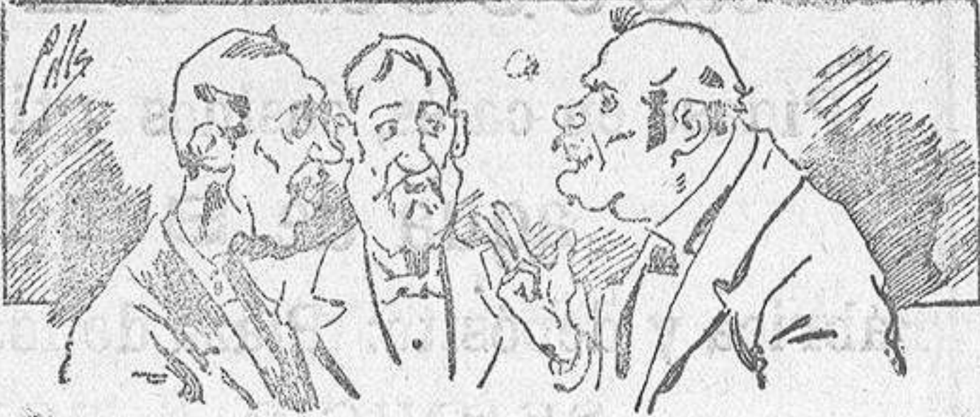
Abominan á nuestros libros..... pero los compran.