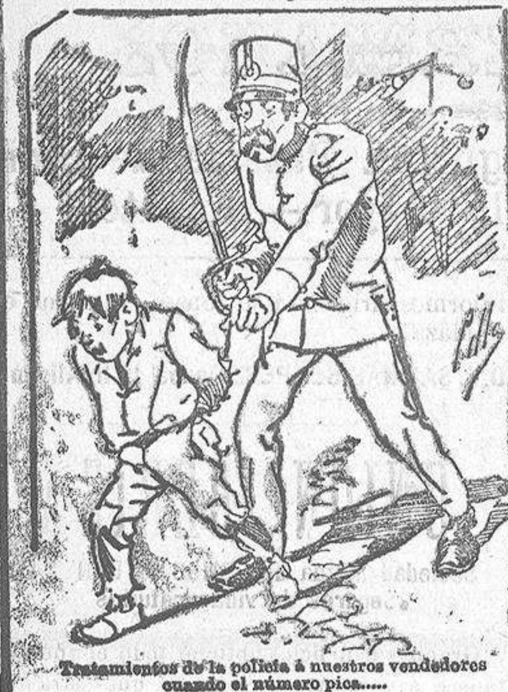
Tratamiento de la polifeta á nuestros vendedores cuando el número pica....