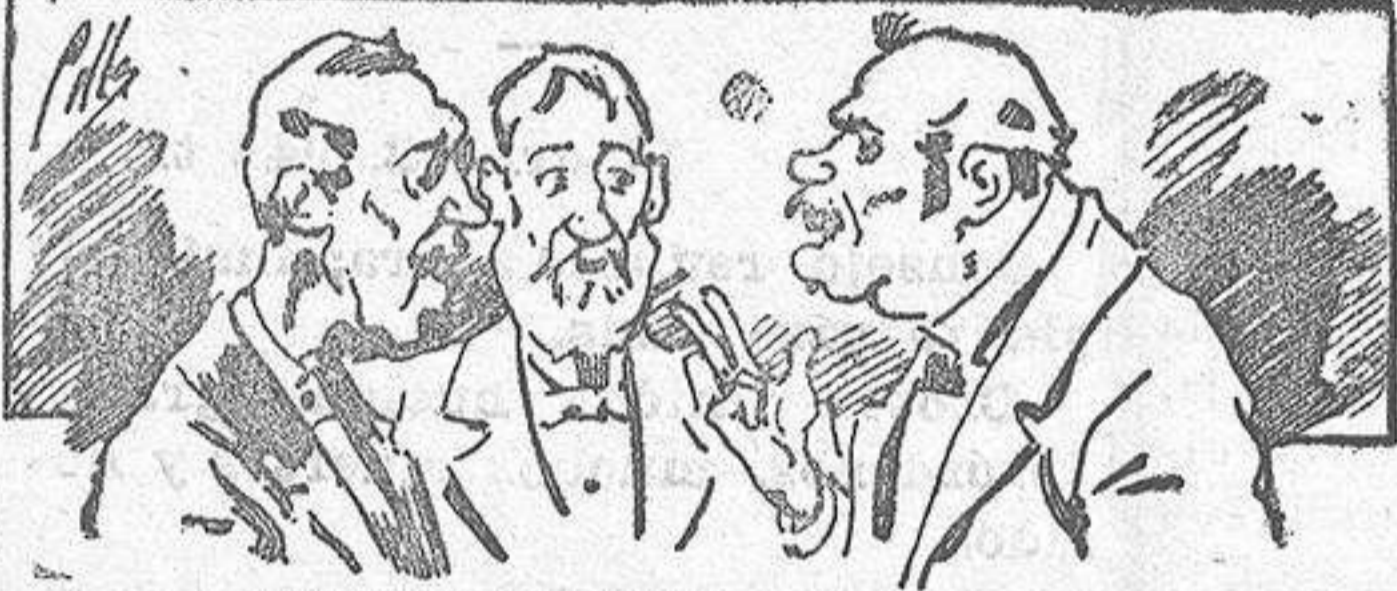
Abominan á nuestros libros....., pero los compran.

Todas las personas de gusto, curiosas é ilustradas deben pedir al Director de LA AVISPA, apartado núm. 8, MADRID, un ejemplar que se remite gratis y franqueado. Esta Revista Enciclopédica Popular publica recreaciones científicas, recetas de cocina, repostería, confitería, vinos, licores, pinturas, barnices, betunes y fórmulas para toda clase de industria, y cuantas noticias y conocimientos puedan ser beneficiosos. Cuenta además con buenos grabados, parte literaria excelente; da regalos mensuales á sus lectores con la Lotería Nacional y participaciones en la misma, á cuyo efecto compra todos los sorteos, y en una de las Administraciones más afortunadas por la suerte, billetes enteros. La suscripción y los números que se nos pidan se sirven gratuitamente á correo vuelto y franqueados, con sólo indicar el nombre y dirección del que lo desea en sobre dirigido al Sr. Administrador de