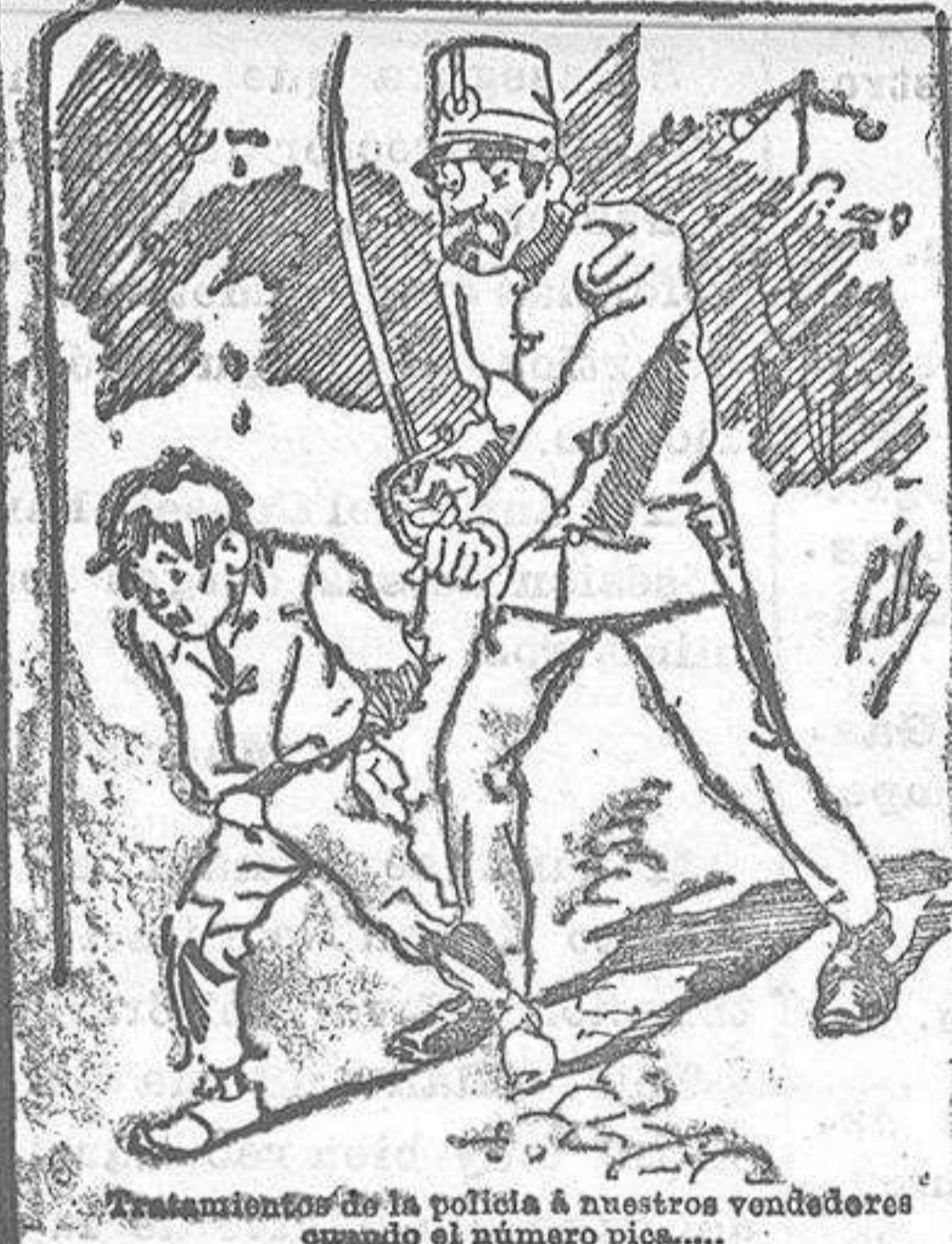
Tratamiento de la policía á nuestros vendedores cuando el número pica.....

lo desea en sobre dirigido al Sr. Administrador de