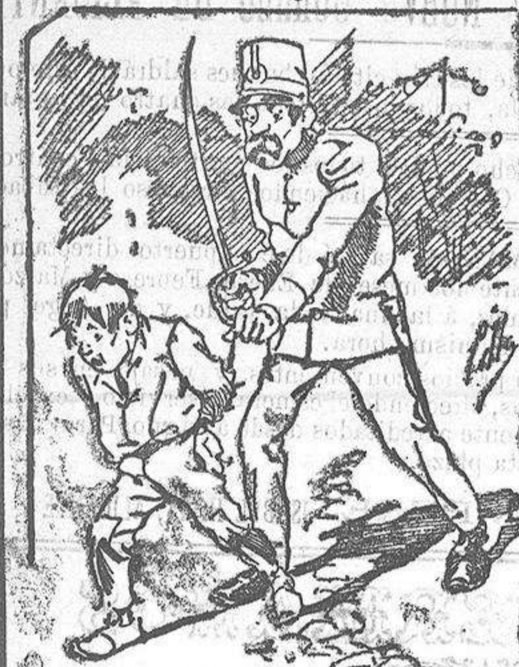
Testamentos de la policía á nuestros vendedores cuando el número pica...

fórmulas para toda clase de industria, y cuantas noticias y conocimientos puedan ser beneficiosos. Cuenta además con buenos grabados, parte literaria excelente; da regalos mensuales á sus lectores con la Lotería Nacional y participaciones en la misma, á cuyo efecto compra todos los sorteos, y en una de las Administraciones más afortunadas por la suerte, billetes enteros. La suscripción y los números que se nos pidan se sirven gratuitamente á correo vuelto y franqueados, con sólo indicar el nombre y dirección del que lo desea en sobre dirigido al Sr. Administrador de