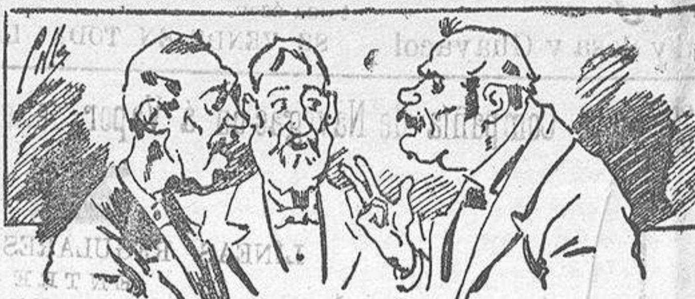
Abonarán á nuestros libros... pero los compran.

Todas las personas de gusto, curiosas é ilustradas deben pedir al Director de LA AVISPA , apartado núm. 8, MADRID, un ejemplar que se remite gratis y franqueado. Esta Revista Enciclopédica Popular publica recreaciones científicas, recetas de cocina, repostería, confitería, vinos, licores, pinturas, barnices, betunes y fórmulas para toda clase de industria, y cuantas noticias y conocimientos puedan ser beneficiosos. Cuenta además con buenos grabados, parte literaria excelente; da regalos mensuales á sus lectores con la Lotería Nacional y participaciones en la misma, á cuyo efecto compra todos los sorteos, y en una de las Administraciones más afortunadas por la suerte, billetes enteros. La suscripción y los números que se nos pidan se sirven gratuitamente á correo vuelto y franqueados, con sólo indicar el nombre y dirección del que lo desea en sobre dirigido al Sr. Administrador de